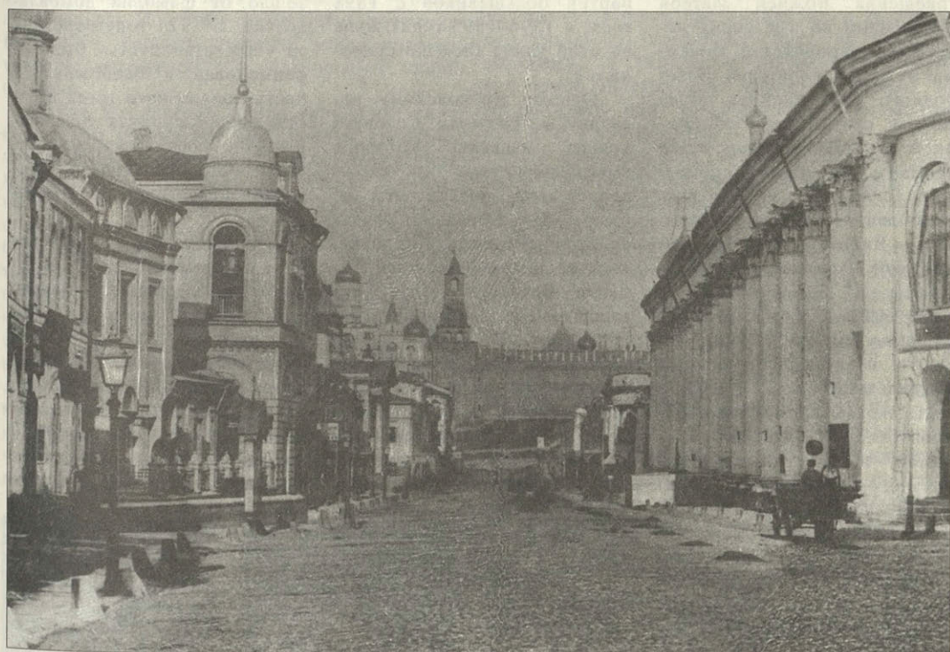
Ильинские ворота. Пока не настал час реконструкции