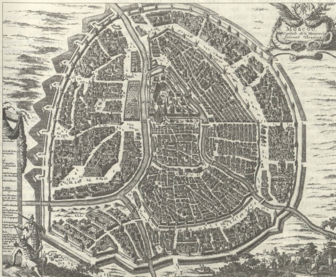
Карта Москвы XVII века

она поражает своими, приблизительно, двумя тысячами церквей, кои почти все каменные и придают городу великолепный вид». А знаменитый писатель XX века Кнут Гамсун говорит о Москве: «Я никогда не представлял себе, что на земле может существовать подобный город: все кругом пестреет зелеными, красными и золочеными куполами и