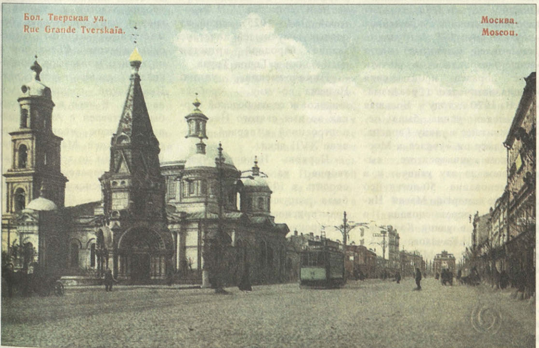
«Диво дивное» в Путинках