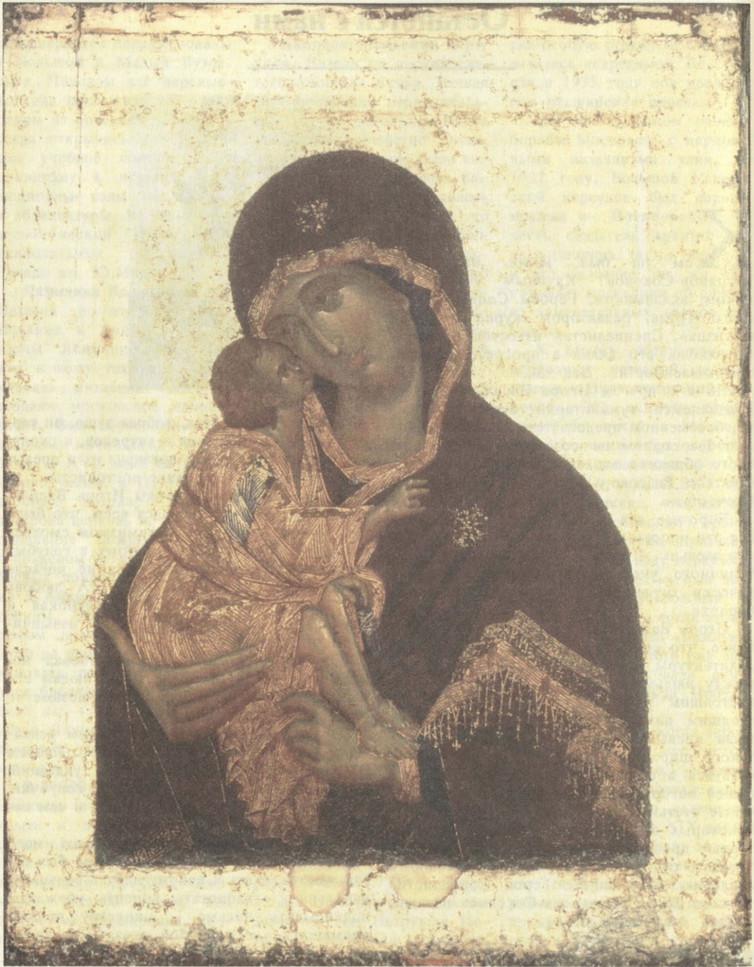
Чудотворная икона Донской Богоматери