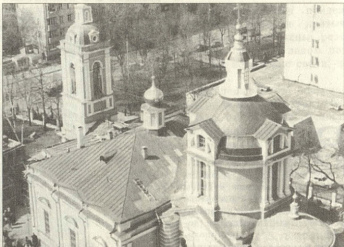
Никола в Кузнецях. Замоскворечье

Многие церкви с двойными названиями известны в истории города с XVII столетия, некоторые из них из дерева, реже – из камня были построены в XIV, XV и XVI веках. Уже самые ранние храмы в Кремле – Иоанна Предтечи под Бором (середина XII века), церковь и монастырь Спаса на Бору (90-е годы XIII века), стоявшие на холме у бора, назывались по их местоположению. На Руси такие наименования со временем изме-