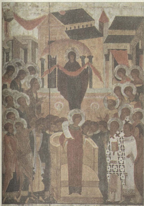
Покров Пресвятой Богородицы XVI век