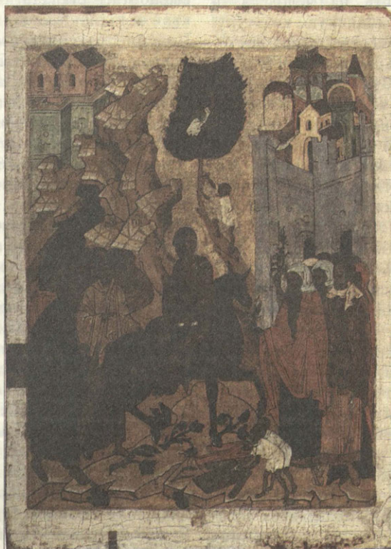
Вход в Иерусалим Первая половина XVI века