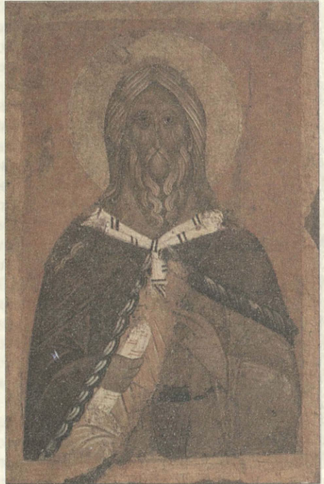
Илья Пророк. XV век

А наше время во многом подобно времени после 1943 года, когда разоренной стране нужно было подымать из руины тысячи поруганных храмов и сотни монастырей. Святой епископ Лука (Войно-Ясенецкий) писал на имя Святейшего Патриарха Сергия (вскоре после знаменательной встречи митрополитов со Сталиным): «...Не следует восстанавливать сильно поврежденные церкви, а вместо них