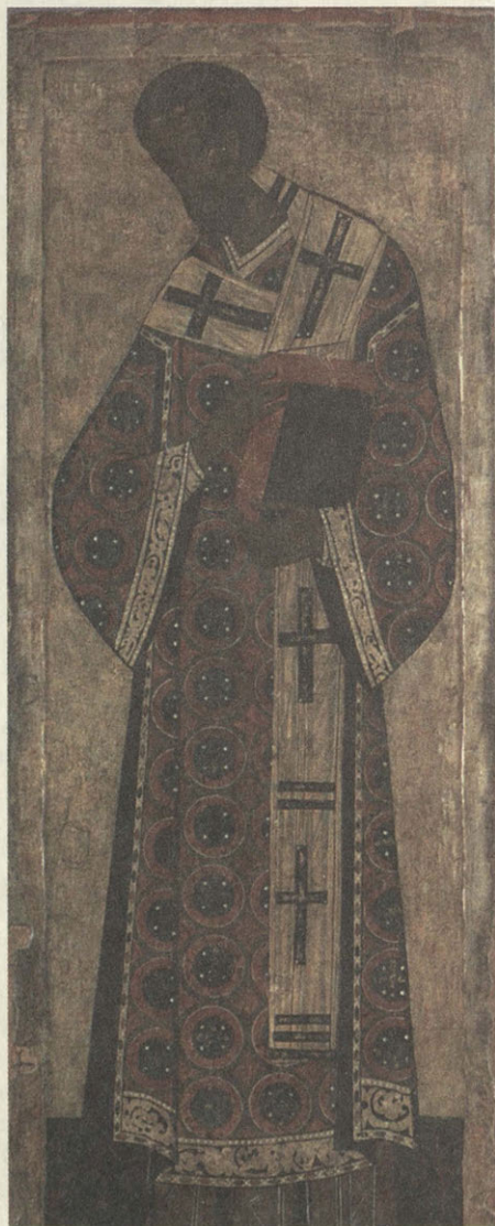
Иоанн Златоуст Середина XVI века

Известно пророчество старцев Оптиной пустыни, согласно которому в последние времена храмы будут полны роскошным убранством и сладкогласным пением,