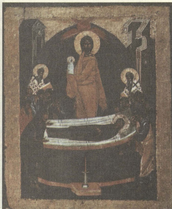
Успение Пресвятой Богородицы XVI век