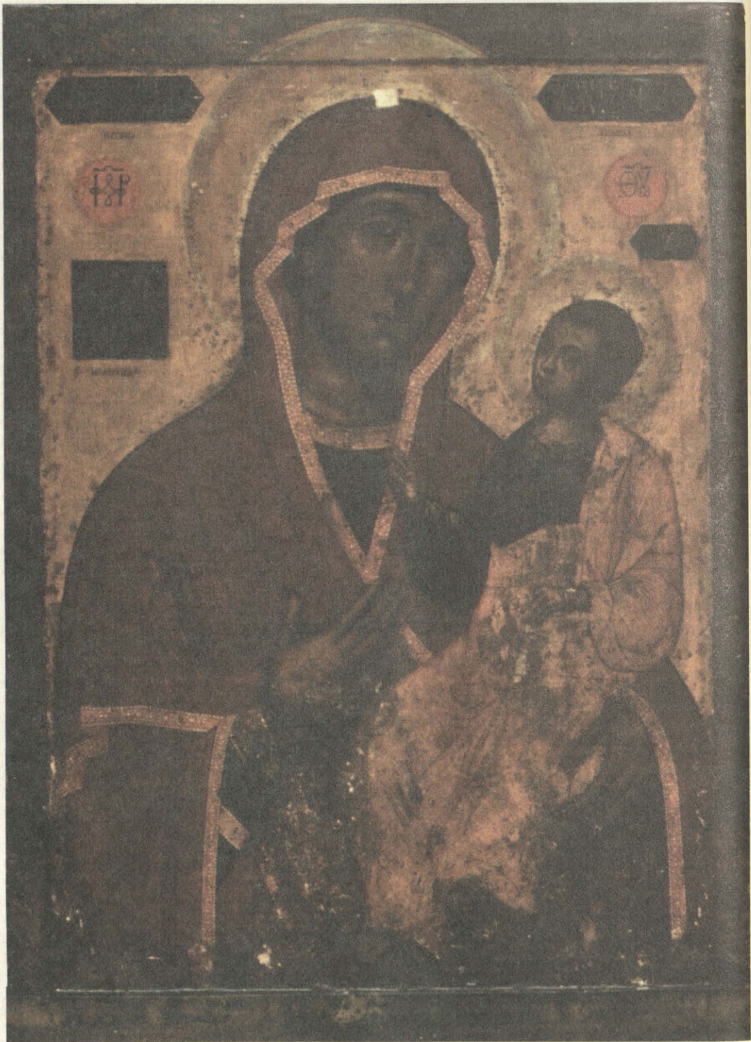
Чудотворная икона Иверской Божией матери