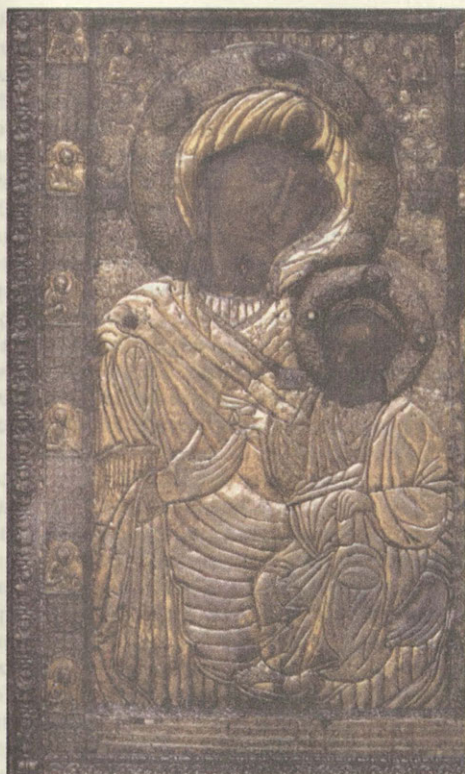
Первообраз Иверской иконы Божьей Матери XII–XIII вв. Афон