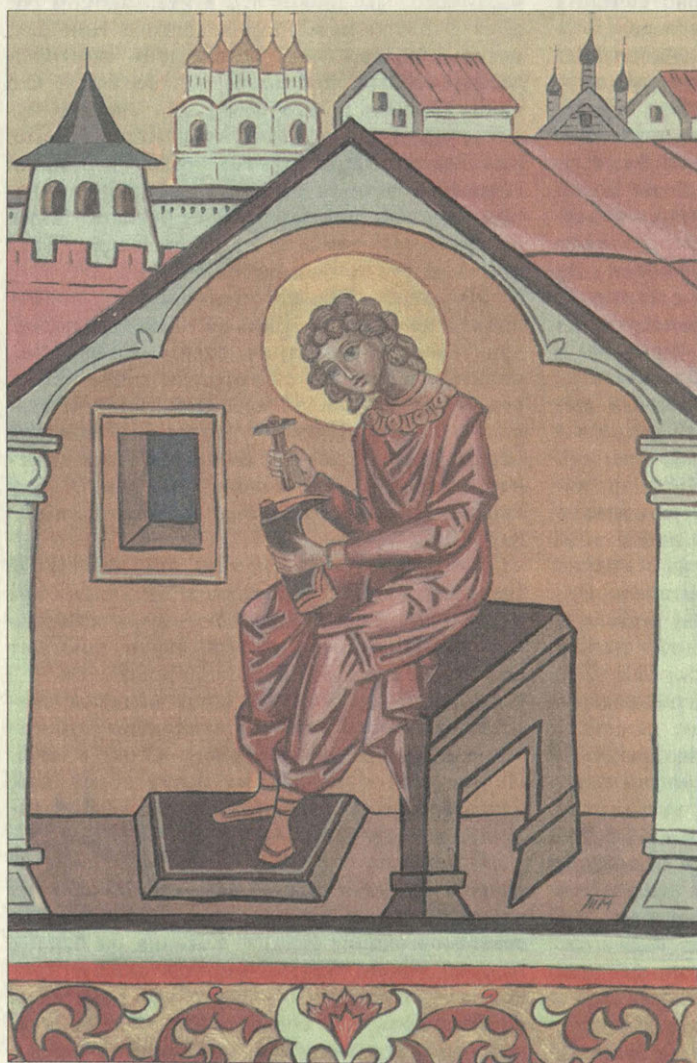
Юность Василия Блаженного

В о второй половине пятнадцатого столетия от Рождества Христова, а от сотворения мира на исходе седьмой тысячи лет в России с ужасом ждали конца света. Тому были знамения: в мае месяце выпал глубокий снег, Ростовское озеро две недели страшно выло по ночам, затмевались луна и солнце.