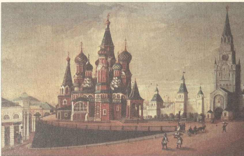
Красная площадь в начале XIX века Миниатюра на шкатулке. Федоскино

ремешок и стянутого вокруг ноги, башмаки-чоботы и шегольские сапоги на каблучке, сделанном из нескольких слоев толстой воловьей кожи и подбитом железной подковкой. Правый и левый сапоги шились одинаково, и заказчик уже сам обтаптывал их по ноге.