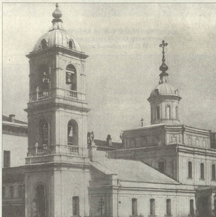
Никольская улица и Казанский собор Литография Дацнaro