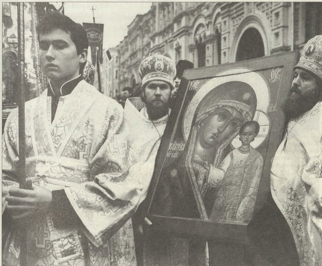
Крестный ход с иконой Казанской Божией Матери в Москве

тают ее за ту самую, коя явилась в Казани 1579 г. 11 ; другие — только за список с нея.