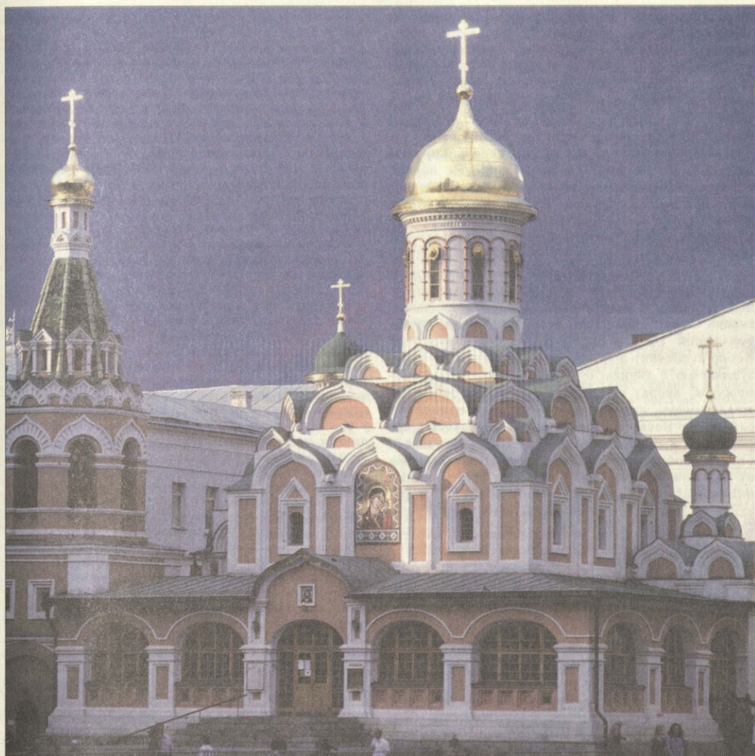
Возрожденный Казанский собор

трибунами на Соборе и приделах черепичные, или с стрельчатыми выступами (накладками) один над другим; на Соборе видно с лицевой стороны таких выступов 7 (в основании 4 и вверху 3), на каждом приделе по 3; главы на Соборе и приделах (особенно на соборе) большие, — все, равно как и на колокольне, сферические; глава Соборная всею массою своею покоится на шее (трибуне), коя одинакового с нею объема; над главою шейка с яблоком, на коем водружен крест; прочие главы без всяких прибавлений, лежат на трибунах или шейках меньшаго против них объема. На плане значится со всех 4 сторон Собора ограда, сделанная с запад[ной] и южной сторон из надолб (тыну, частокола или решетника), с прочим — сплошная деревянная (забор) или каменная, неизвестно; мерою с запад[ной] стороны «по большой улице с полуденной (в отнош[ении] к Кремлю от Никольской башни?) стороны длина ограде 31 (17) саж[ен]», с южной «от Ножевого ряда длина ограде