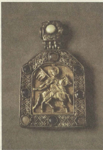
Святой Георгий Победоносец XVI век

На Руси иконы Георгия, сказания и духовные стихи о Егории Храбром особенно прижились, сроднились с душой народа. Многие из строителей Российской государственности носили это имя – в древнерусском княжеском именованье, как правило, в форме Юрий. Город Юрьев, сегодняшний Тарту, основанный Ярославом Мудрым, в крещении Георгием, – первое тому свидетельство. Город Москва, основанная на сто лет позже Юрием Долгоруким... Нижний Новгород, основанный великим князем Владимирским Георгием Всеволодовичем (он возглавит оборону Руси против монгольского нашествия и будет убит татарами в 1238 году). Три Юрия, три горо-