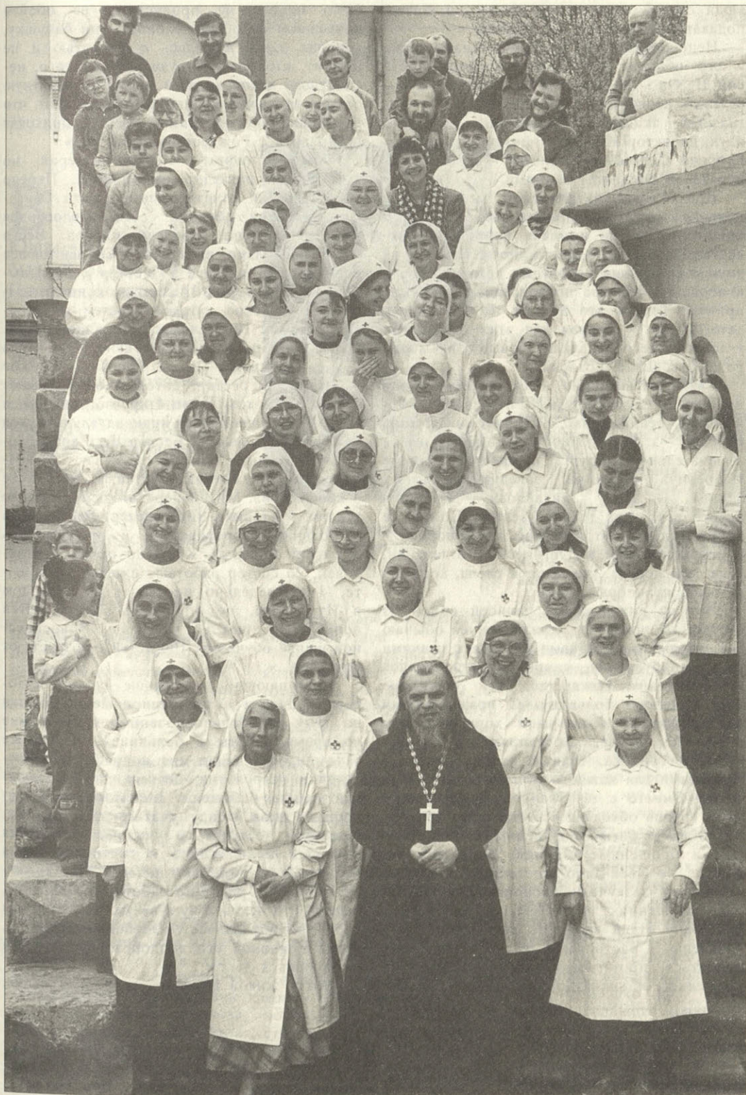
Белые одежды сестер милосердия. В белое была одета и сама Елизавета Федоровна