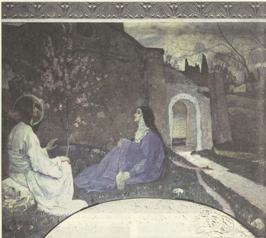
Фреска М.Нестерова в храме Марфо-Мариинской обители