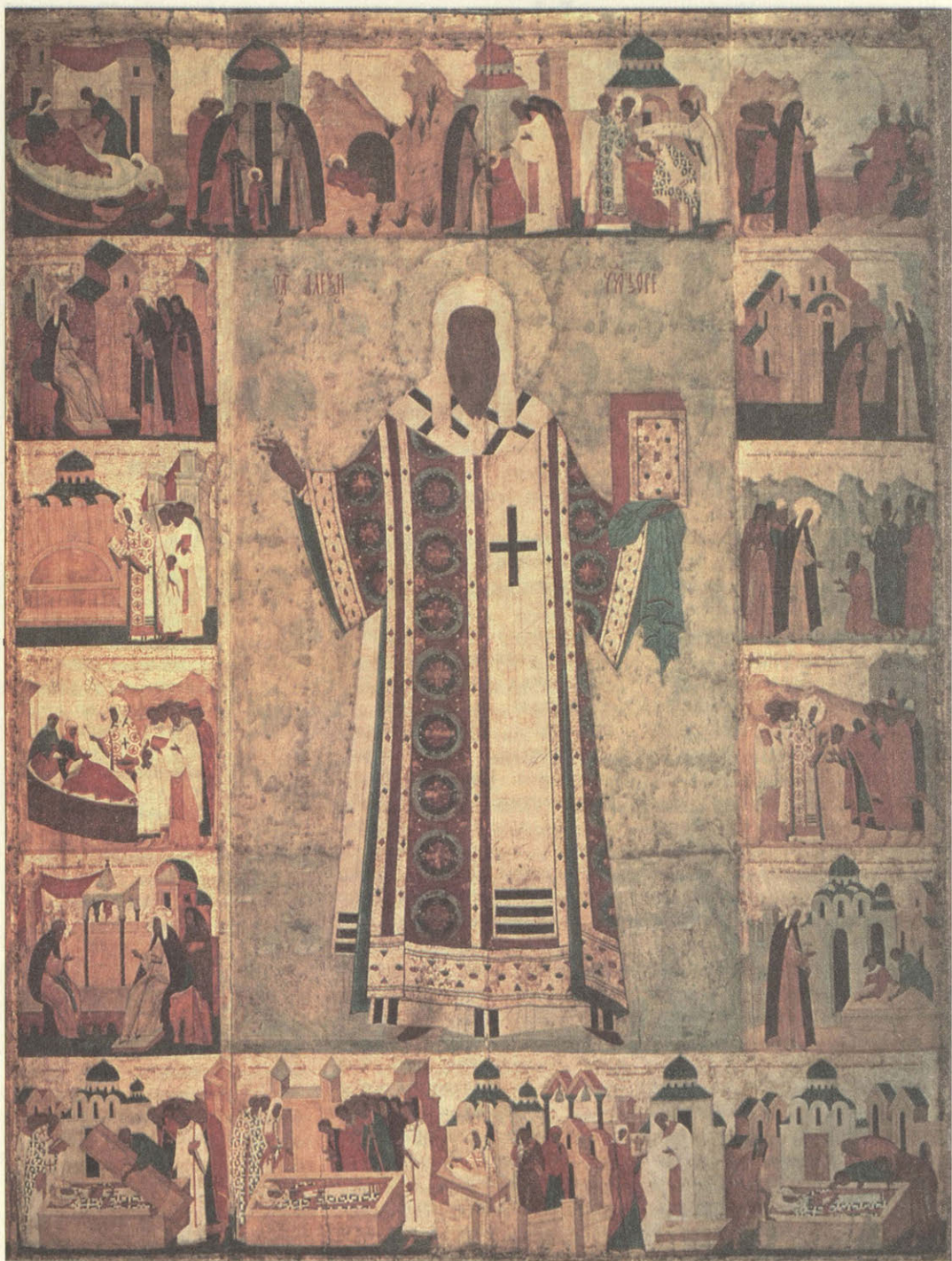
Алексий, Святитель Московский