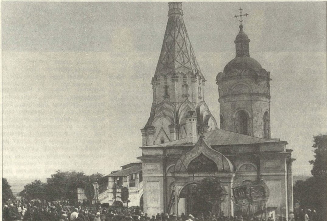
Крестный ход в Коломенском

Хорошо известны обычные для всего православного мира шествия вокруг церкви в пасхальную неделю, в праздник Богоявления 6/19 января для освящения воды, в память крещения Иисуса Христа 1/14 августа – крестные ходы из нескольких храмов для водосвятия. Это последнее действо