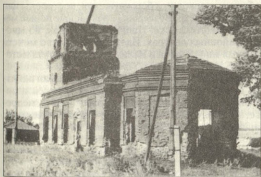
Село Наheжино вновь украсилось Дмитриевским храмом. Наглядный пример искусства реставраторов!