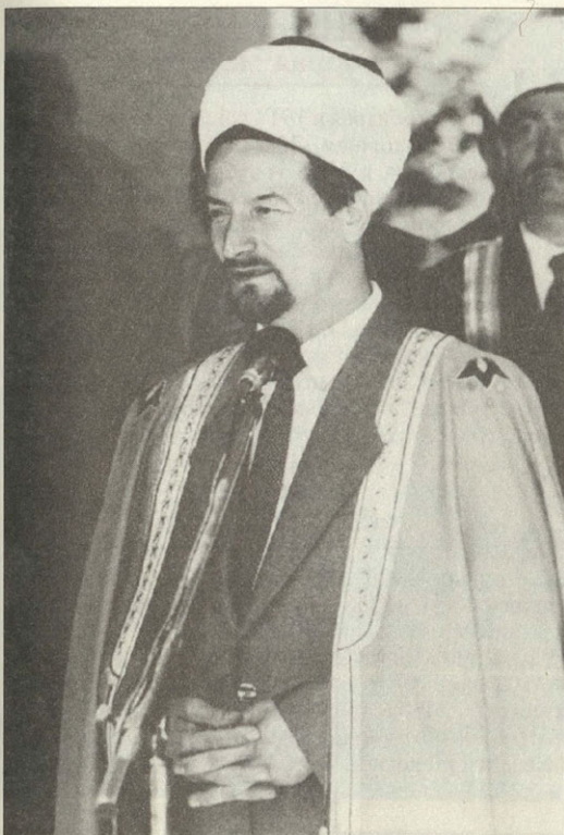
Глава мусульман России и стран европейской части СНГ муфтий Талгат Таджуддин

комиссией для мечети было определено место в середине квартала, а по углам отведены места для строительства дома муфтия, а также для домов служителей мечети и приезжих магометан.