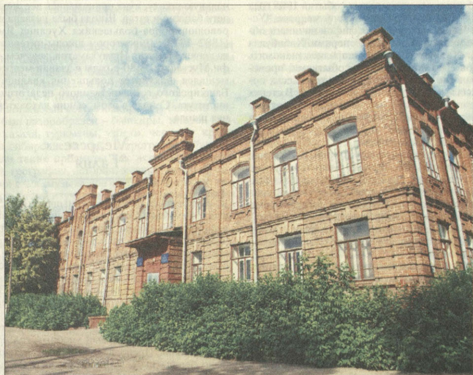
Соборная мечеть в Уфе