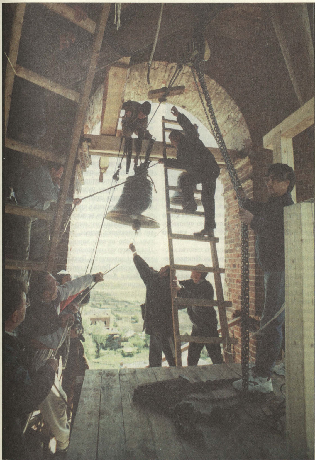
Вновь зазвучал благовест над Николо-Березовкой