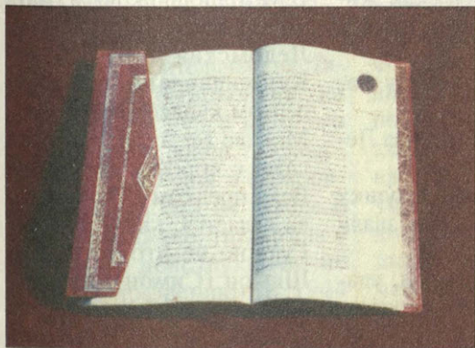
Сначала было слово... Христианский Катехизис и главная книга мусульман — Коран из библиотеки Градо-Уфимского Богородского храма

храма кроме закрытого в бывшем селе Богородском. С церкви еще до войны сняли кресты и сбросили главы, снесли колокольню. Вплотную поднялось здание школы, а помещение, где некогда шли богослужения, превратили в спортзал. Позже поселок стал сокращенно называться ИНОРСом – поселком “иностранной ра-