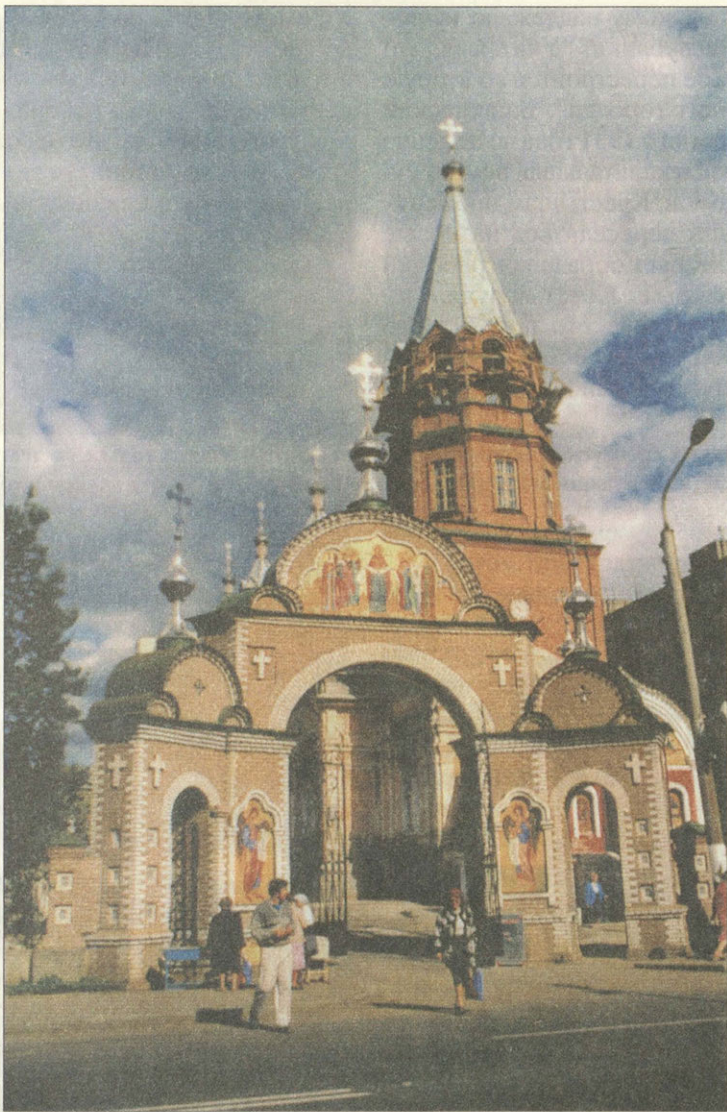
За узорочной аркой – Богородская церковь, воссозданная практически заново