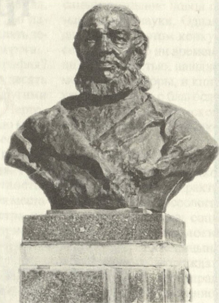
Памятник С.Т. Аксакову у Аксаковского народного дома в Уфе

По вполне понятным причинам у нас сложился ограниченный, этакий идиллически-судальный образ С.Т.Аксакова, как далекого от общественно-политического движения своего времени писателя-краеведа, мастера пейзажа: "Как о рыбной ловле, об охоте написал! О грибах написать собирался, но вот, жалко, не успел..." Ладно, что хоть такую "характеристику" выдали, странно, что вообще грязью не вымазали, хотя тут старался сам нарком не