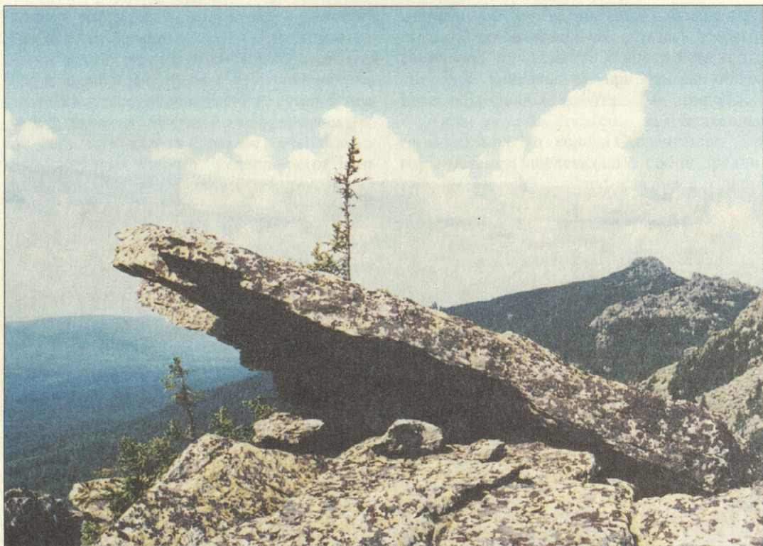
Необузданна фантазия уральской природы