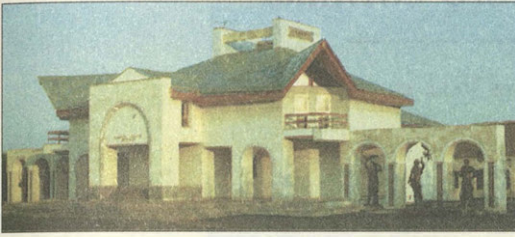
Музей Салавата Юлаева в селе Малояз

по его искусству отряжаем был противу мятежников в поле, и от успехов его получил себе великую славу”.