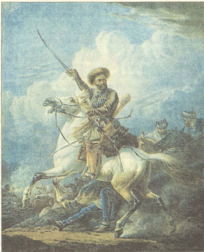
А. Орловский. Всадник-башкир