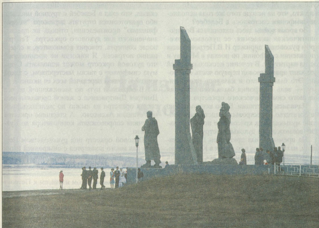
Памятник воинам Великой Отечественной войны в городе Дуртули