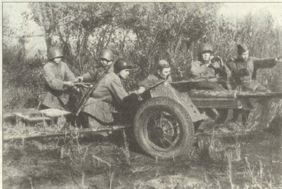
Артиллеристы 112-й Башкирской дивизии. 1942 год