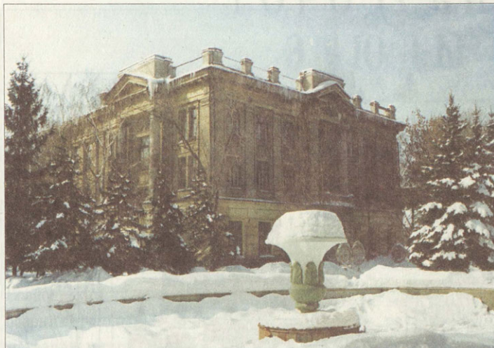
Ансамбль университетского городка напоминает величественные дворцовые ансамбли Петербурга. Здания великолепно смотрятся в любую погоду