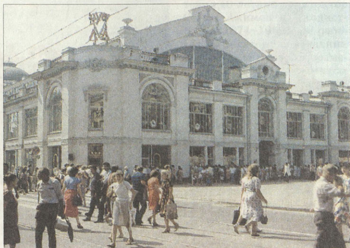
Остекленные перекрытия Крытого рынка — подлинный триумф инженерной мысли начала века

Проект был принят городской думой в 1910 году, но еще три года дорабатывался архитектором. В 1914 году строительные работы начались. Закладка фундамента здания проходила в торжественной обстановке — в присутствии губернской администрации, коллектива проек-