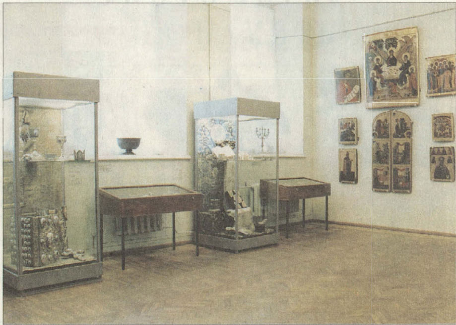
Общий вид экспозиции древнерусского искусства в Радищевском музее