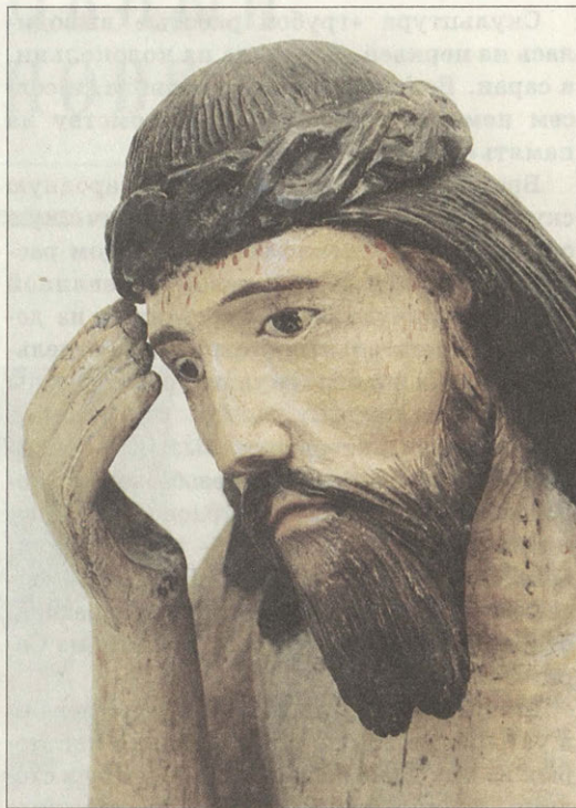
Скульптура «Сидящий Спаситель» Россия, XVIII век Фрагмент