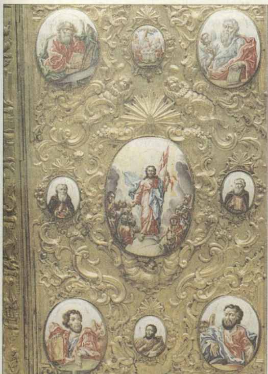
Оклад Евангелия 1780 год, Москва Верхняя крышка