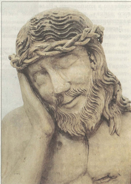
Скульптура «Сидящий Спаситель» Россия, XVIII век Фрагмент