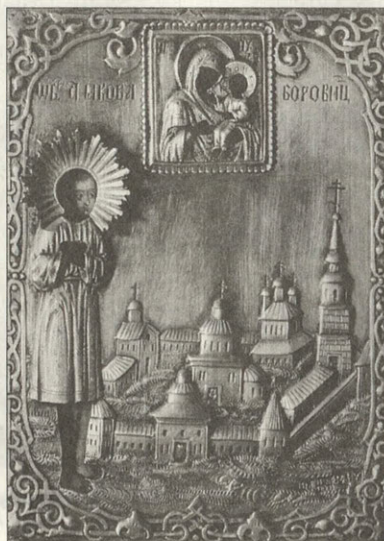
Икона в серебряном окладе «Иаков Боровицкий» Оклад — Саратов, 1871 год

Каждое из представленных произведений искусства неповторимо и дает нам редчайшую возможность увидеть и ощутить далекое от нас время.