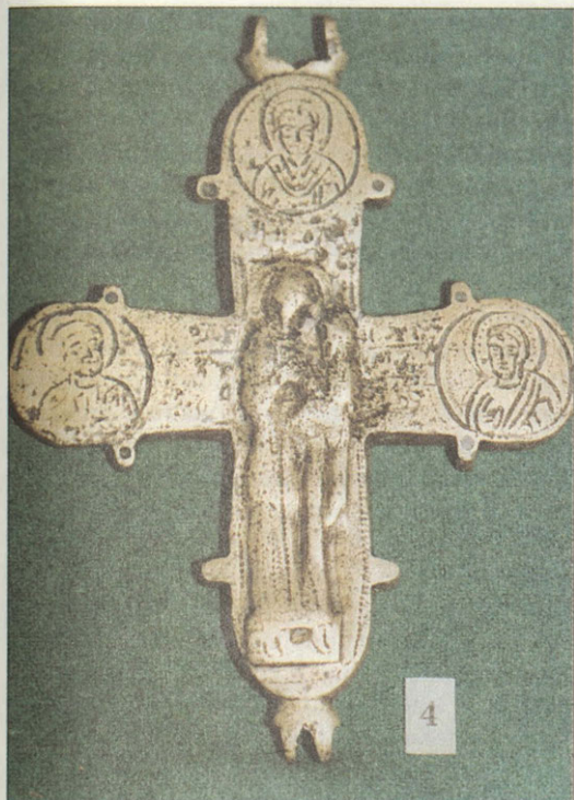
Крест-энколпион Начало XIII века