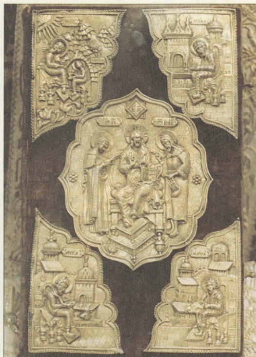
Оклад Евангелия 1699 год