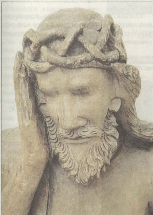
Скульптура «Сидящий Спаситель» Россия, XVIII век Фрагмент