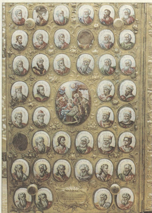
Оклад Евангелия 1780 год, Москва Нижняя крышка