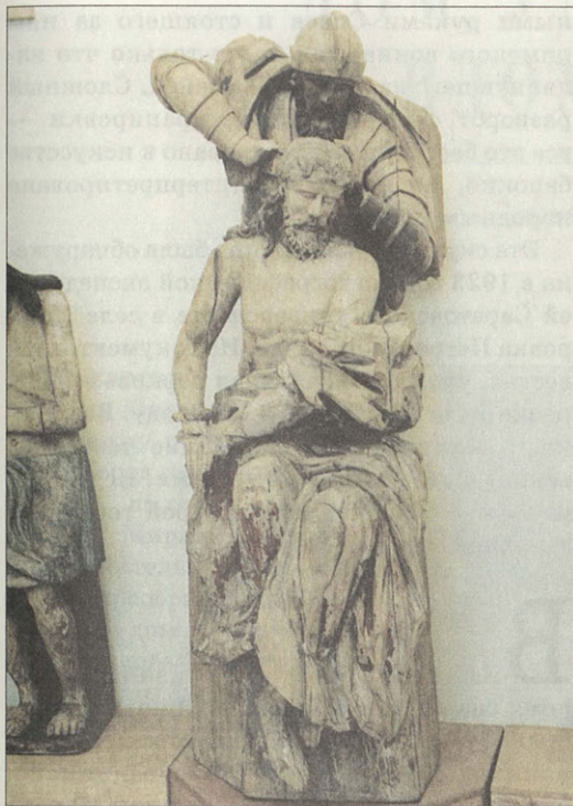
Скульптурная композиция «Надевание тернового венца» Россия, XVIII век