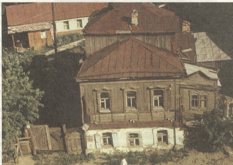
Дом художника Фотография 1989 года

Повзрослев, Павел стал посещать в Саратове студию при Обществе любителей изящных искусств, где преподавателями были художники Г.П.Баракки и В.В.Коновалов. Затем, перед поступлением в Московское училище живописи, ваяния и зодчества, он брал уроки в только что открывшемся Боголюбовском рисовальном училище.