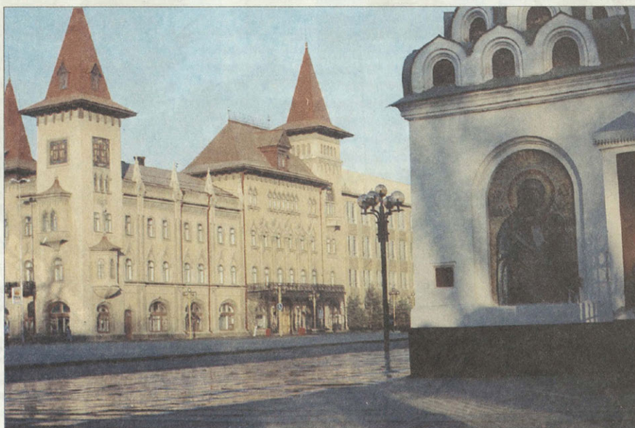
Здание Саратовской консерватории — первой в российской провинции

Помимо этого дирекция незамедлительно распорядилась открыть в сентябре 1873 года Музыкальные классы. Однако благое начинание едва не заглохло — из-за отсутствия опытных педагогов количество учащихся неумолимо сокращалось. Но через десять лет отношение саратовцев к музыкальному