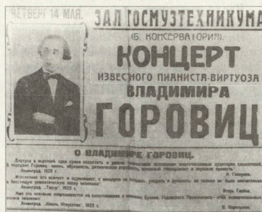
Афиши концертов в концертном зале Музыкального техникума. 1925 год

писал Рахманинов, — и, если их ходатайство о консерватории будет уважено (а я слышал, будто бы даже ассигновка прошла в Гос. думе), то совесть моя будет не совсем покойна и чиста. Главным и почти единственным ЗА (что и в тексте ходатайства замечается) служит их здание — действительно хорошее! (Но я и сейчас позволю себе сказать, что этот довод мало убедителен.) Да еще, пожалуй, личность самого директора как администратора. Что же касается, например, личности директора как преподавателя, да и почти всех остальных преподавателей, то они произвели на меня довольно сильное, но притом отрицательное впечатление».