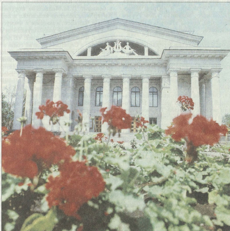
Академический театр оперы и балета