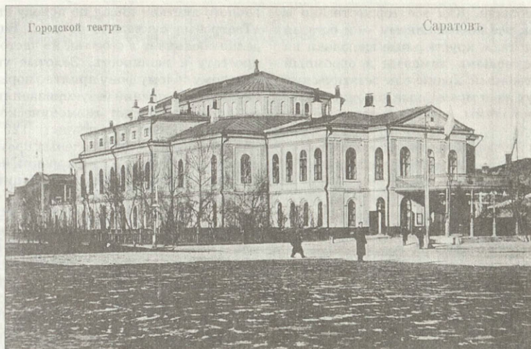
Городской театр Построен в 1864–1865 годах архитекторами К.Тиденом и А.Салько Открытска начала XX века

На этом месте — современное здание Театра оперы и балета