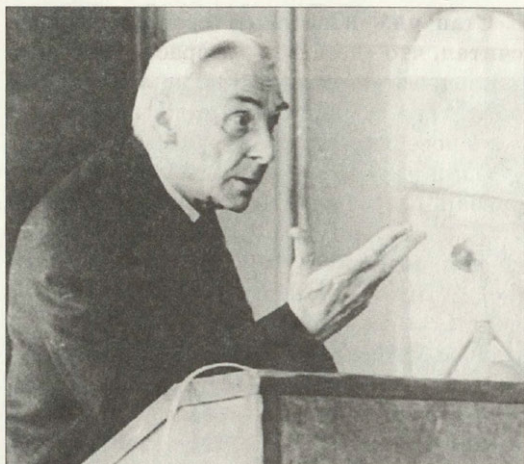
К.А.Федин выступает перед студентами Саратовского университета

валась до замужества мать Константина Федина. Ровно сорок лет спустя, в 1939 году, став известным писателем, Федин приехал в Саратов и зашел в знакомый двор... Об этом посещении своей первой школы Федин написал рассказ «Встреча с прошлым».