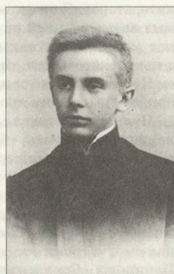
К.А.Федин Фотография 1975 года