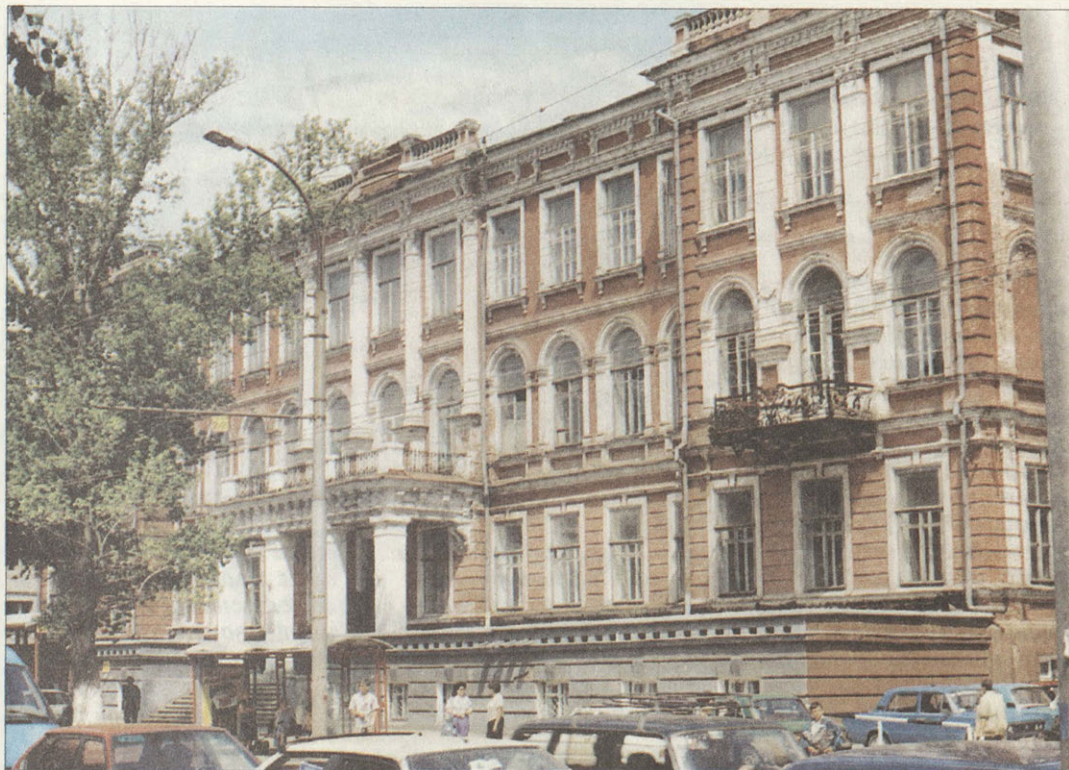
Здание бывшего Коммерческого училища (ныне корпус Саратовского агроинженерного университета)

«В 1901 году я поступил в Коммерческое училище. Память о нем сохранила мало хорошего. Но в его стенах я испытал с товарищами переживания, которые принесены были русско-японской войной и особенно революцией. Открывался впервые волнующий реальный мир над пределами наших ребяческих фантазий, над уроками и учебниками. Мир этот был связан для меня с самым ранним впечатлением больших уличных событий, кото-