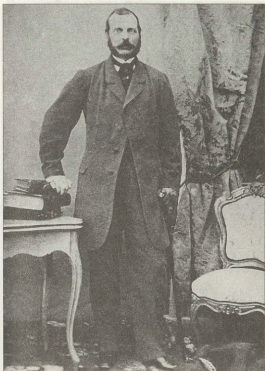
Император Александр II Фотография 1860-х годов