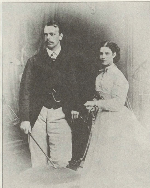
Цесаревич Александр Александрович с невестой — принцессой датской Дагмарой (будущей императрицей Марией Федоровной) Вторая половина 1860-х годов Публикуется впервые