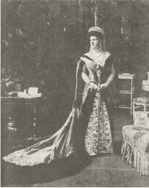
Великая княгиня Мария Павловна, президент императорской Академии художеств 1913 год Публикуется впервые

криками «ура». Управляющий саратовской губернией П.М.Боярский зачитал текст поздравительной телеграммы, посылаемой от имени торжественного заседания архивной комиссии.