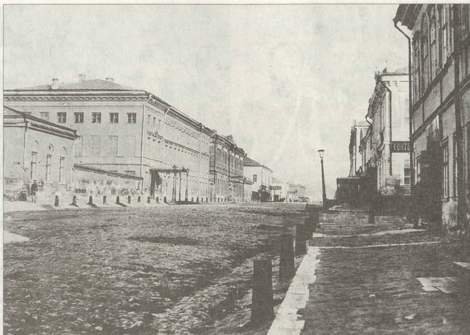
Дом Дворянского собрания на Московской улице Фотография второй половины XIX века Здание не сохранилось

саратовскому губернатору М.Н.Галкину-Враскому и всем причастным к наведению в городе «отличного порядка, чистоты и благоустройства» монаршего благоволения. К приезду Александра II в Саратов было приурочено и открытие Александровского ремесленного училища.