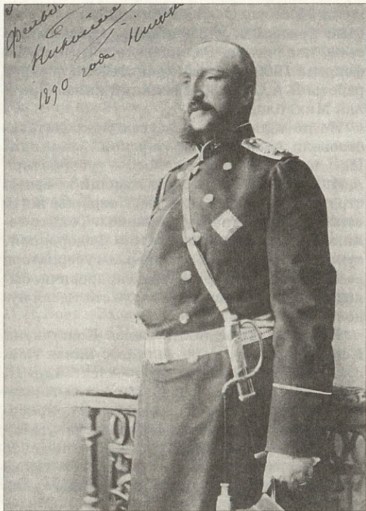
Генерал-фельдмаршал великий князь Николай Николаевич-старший 1890 год