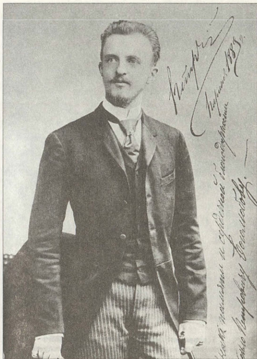
Великий князь Петр Николаевич (слева) 1889 год