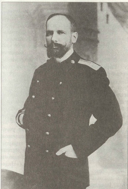
П.А.Столыпин — саратовский губернатор Фотография 1904 года