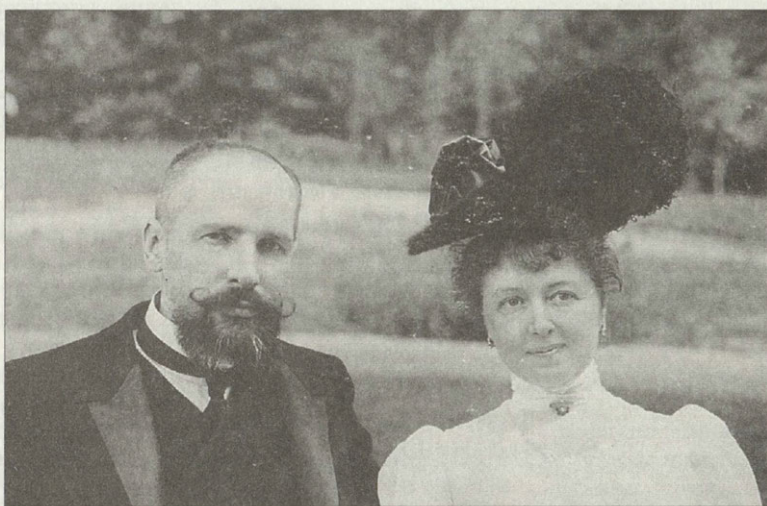
Петр Аркадьевич Столыпин с супругой Ольгой Борисовной, урожденной Нейдгардт Фотография 1900-х гг.

большой комод с бронзовыми украшениями и мраморной доской в стиле Людовика XVI, две пары бронзовых стальных канделябров, две бронзовые люстры с хрустальными украшениями в стиле Людовика XVI. Мебель была сделана в Петербурге на фабрике Мельцера.