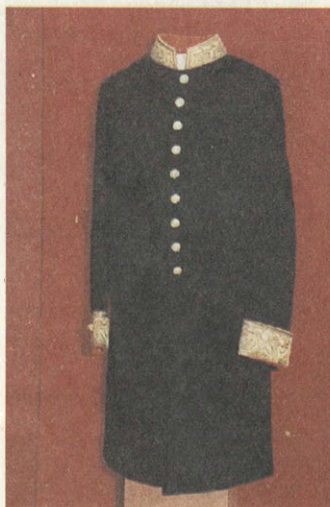
Парадный мундир, кресло №5 из Киевского городского театра, в которое рухнул смертельно раненный премьер-министр, обгаренная его кровью военная шинель Саратовский областной музей краеведения

За три года губернаторства Столыпина в Саратове было построено здание Мариинской женской гимназии, покрыты асфальтом улицы Никольская и Александровская. Губернатор добивается для города городского займа — 965 тысяч рублей — на устройство водопровода и мостовых. Начинается модернизация городской телефонной сети. В 1904 году состоялись пробные пуски газового освещения, открываются