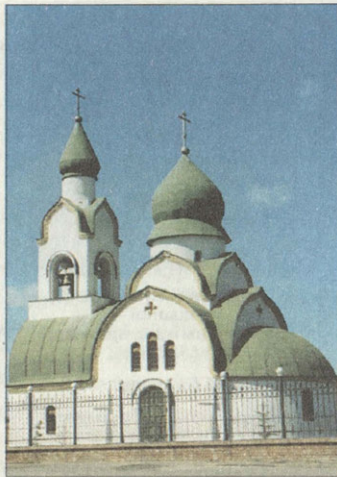
Церковь Дмитрия Солунского в селе Столыпине — бывшем имении отца П.А.Столыпина Построена в 1997 году

Среди других ценных экспонатов Музея Столыпина следует отметить тринадцать книг стенографических отчетов Государственного совета за время пребывания Столыпина в должности министра внутренних дел (поступили они от Государственной канцелярии) и тридцать книг стенографических отчетов Государственной думы трех первых созывов, поступивших от Управления государственной типографии. Главное управление по делам печати по ходатайству Музея памяти Столыпина в декабре 1913 года прислало два ящика газет «Русское бо-