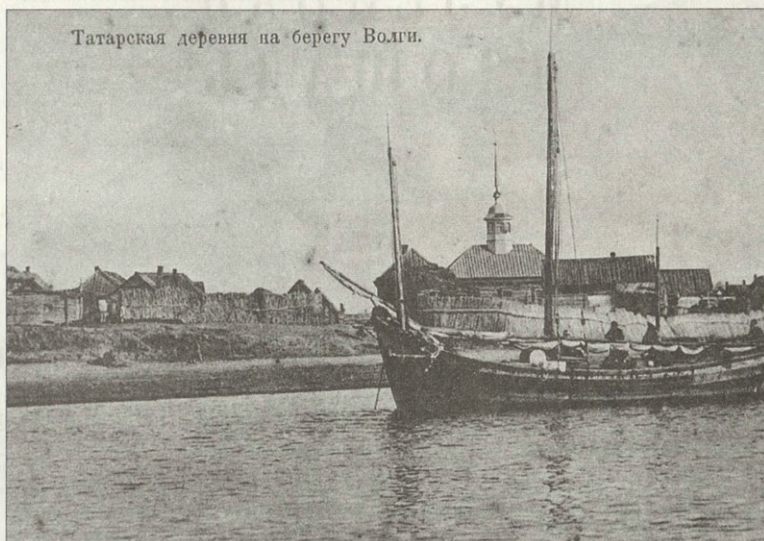
Татарская деревня на берегу Волги.