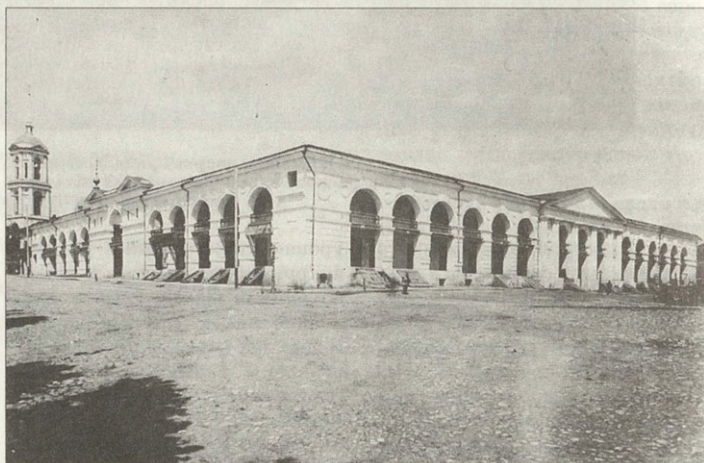
Здание Управления Рязанско-Уральской железной дороги Гостинный двор. Не сохранился Фотографии начала XX века

было восстановлено, но парадное крыльцо и фронтоны главного и дворового фасадов были разобраны.