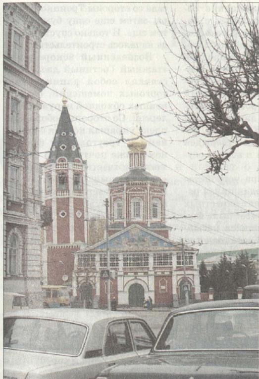
Троицкий собор — древнейший архитектурный памятник города и области

огромное дворовое место до берега Волги. Пользуясь присутствием в Саратове петербургских архитекторов, он заказал И.Ф.Колодину проект соединения двух зданий в одно с обработкой не хуже столичного главного фасада. И это при том, что в то самое время он восстанавливал свой московский дом на Воздвиженке, купленный в 1805 году у генерал-майора Талызина и сгоревший в 1812 году — тот, где ныне Музей архитектуры им. А.В.Щусева. Строил Устинов не скупясь на искусственный мрамор, скульптуру, расписные плафоны, фаянсовые и майоликовые печи.