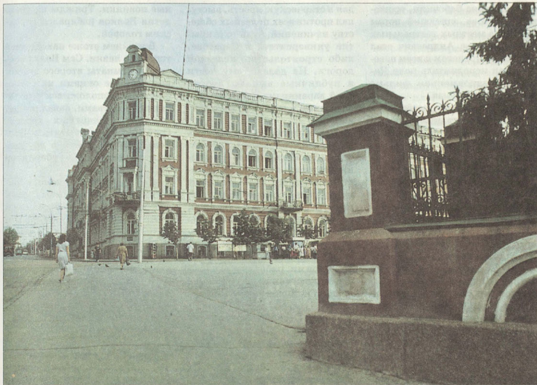
В здании, построенном архитектором А.М.Салько, по сей день размещается Управление Приволжской железной дороги

строения и закрывают виды их». Выводы были решительны: лавочки перенести на недостроенное место близ самой реки Волги, а безобразные лавки просто уничтожить.