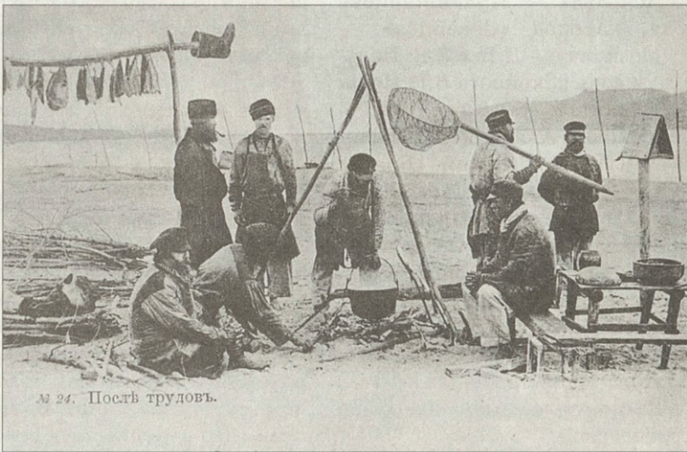
м 24. Постѣ трудовѣ.

На местных открытках дореволюционной поры излюбленной темой были бескрайние волжские просторы Эти открытки доносят до нас аромат ушедшей эпохи