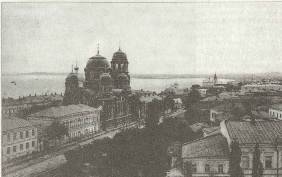
Крестовоздвиженский монастырь до разрушения

и монастыря. На следующий год — нашествие в августе отрядов Пугачева. Голод 1775 года еще более ухудшил положение обители. Насельник из-за бедности становится все меньше, прекращается прием послушниц. И в 1777 году Крестовоздвиженский монастырь становится заштатным, то есть лишается всякого, даже скудного казенного вспомоществования. В 1780 году здесь доживают свой век всего четыре престарелые монахини. Наконец, в 1790 году саратовский женский монастырь упраздняется, а храм его становится приходским.