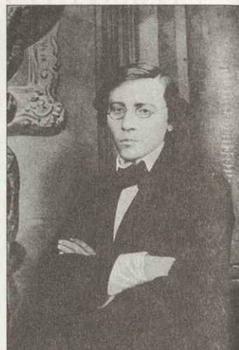
Николай Гаврилович Чернышевский 1859 год

Уезжая из Саратова в Петербург, Чернышевский еще не знал, какое бурное десятилетие ожидает его впереди. Пройдет совсем мало времени, и его как талантливого публициста, авторитетного литературного критика, философа и социолога, глубокого экономиста, узнает вся Россия, и он станет идейным руководителем целого поколения людей, вошедших в историю общественной мысли под именем «шестидесятников».