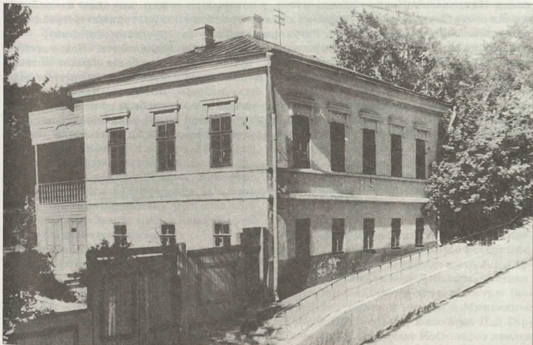
Дом Пыпиных на музейной усадьбе Фотография 1971 года

А.Н.Пыпин стал автором более 1200 работ по истории русской, славянских