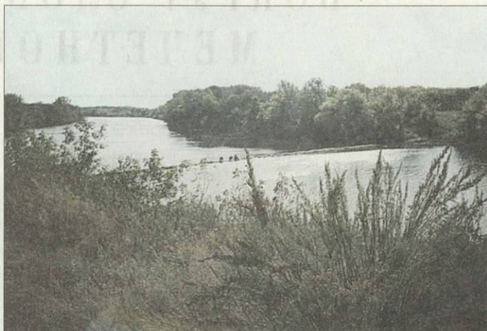
Река Большой Иргиз возле Средне-Никольского старообрядческого монастыря

Однако окончательное уничтожение иргизских монастырей произошло позже. Старообрядцы сопротивлялись как могли. В народе появились фальшивые указы о дозволении строительства раскольничьих часовен и беспрепятственного отправления в них богослужений по старой вере. На этом указе раскольники построили целую сис-