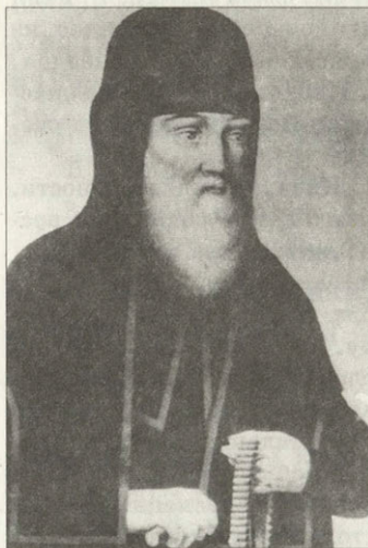
Монах и монахиня — беглопоповцы Рисунки начала XIX века

Чуть позже Прохор добился того, что земли, занятые монастырями, были выделены в особую часть при начатом генеральном размежевании земель в Саратовской губернии и отданы монастырям в вечное