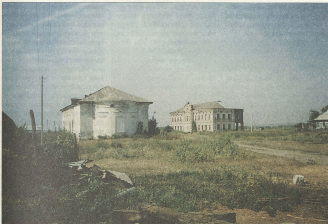
Почти все, что осталось сегодня от Средне-Никольского старообрядческого монастыря близ города Пугачева

Большинство из них было либо унизано жемчугом, либо покрыто серебряными вызолоченными ризами. Немало имелось и других драгоценностей. Чего стоило хотя бы медное, но густо высеребрянное шестиярусное паникадило с 54 подсвечниками и общим весом 18 пудов, висевшее посреди церкви Нижне-Воскресенского монастыря.