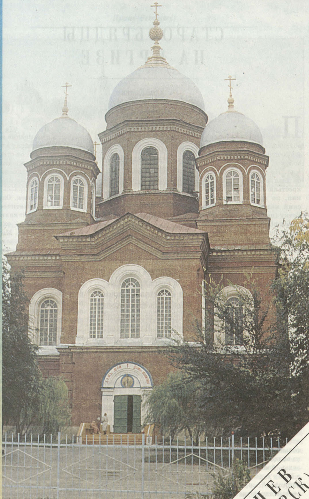
Иоанно-Предтеченский собор. 1899