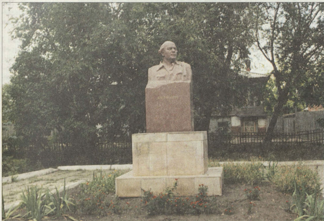
Иоанно-Предтеченский собор 1899