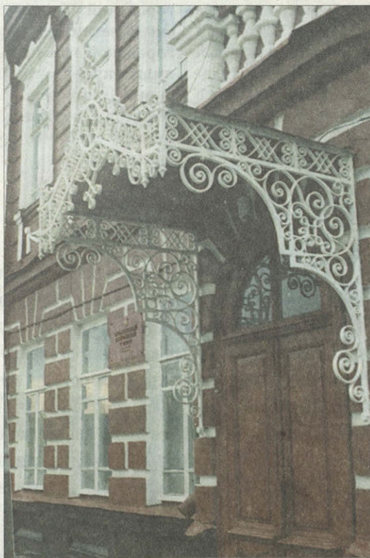
Купеческий особняк 1900-е годы