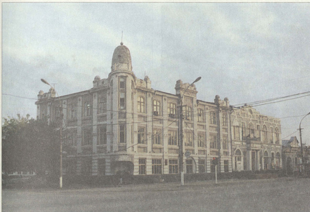
Торговый дом братьев Шмидт 1912 Ныне административное здание

инок Исаакий. С группой иноков и бельцов он занял обросший со всех сторон дремучим чернолесьем полуостров между изгибом Иргиза и озером Калач, соединенный с землей только узким перешейком.