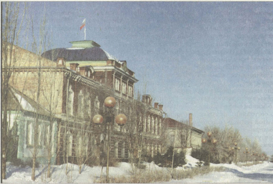
Новоузенское земство Начало XX века Ныне здание районной администрации

районирования и на этой основе создав первую сетку хозяйственных районов страны. Благодаря его работам начинается широкое развитие экономической географии в России. Арсеньев не был кабинетным ученым. Он много и охотно путешествовал по стране, собирая экономико-географический материал для своих исследований. «Целью путешествий моих, — писал он, — было тончайшее познание отечества и наблюдение над внутренними разнообразными его силами».