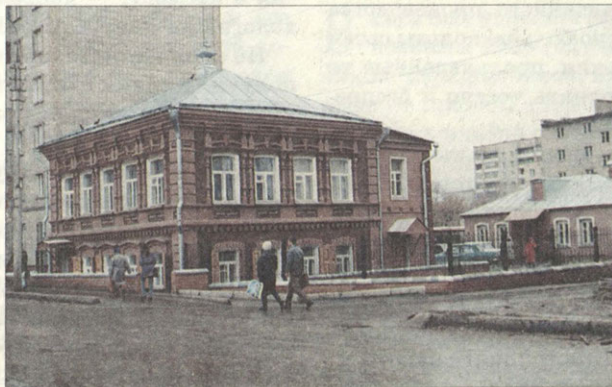
Музей Льва Кассиля на бывшей Аткарской улице

В доме оставались жить родители. Дети разлетелись из гнезда, сохранив в душе память о Покровске, родном городе детства, улицами которого они «входили в жизнь».