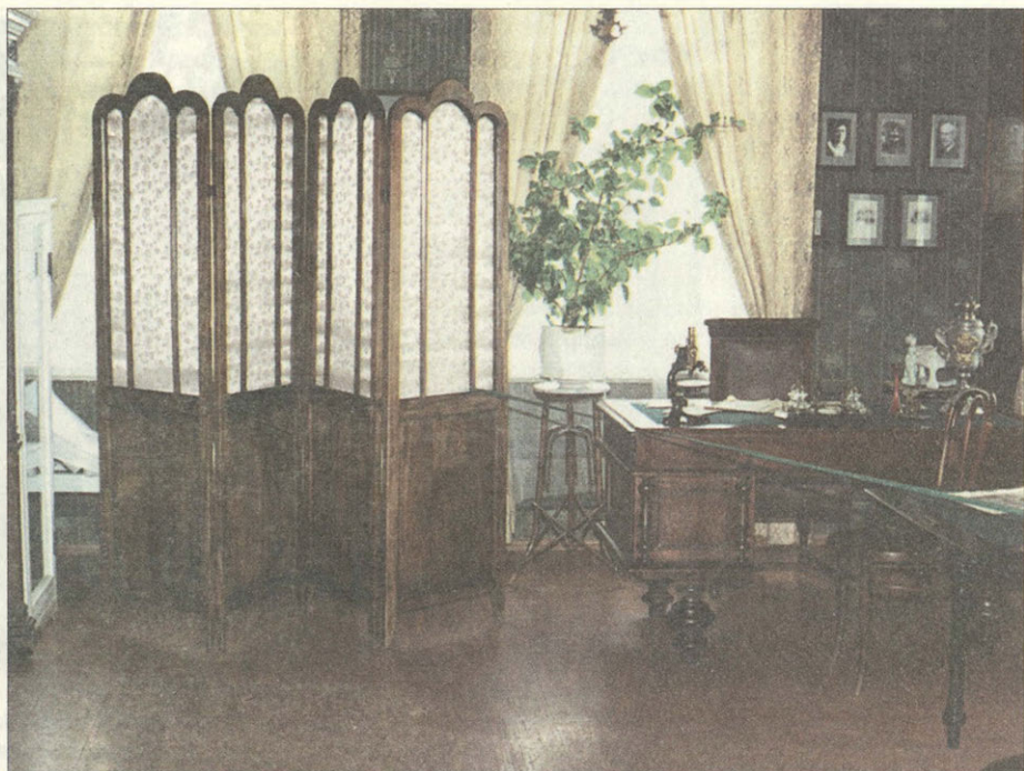
Зал «Кабинет А.Г.Кассиля» Фрагмент музейной экспозиции

институт). И порядки здесь тоже были насквозь «казенные». Над всеми гимназистами довлел и безраздельно господствовал «Кондуит». Так назывался штрафной дисциплинарный журнал, в котором записывались все провинности гимназистов. В переводе с французского это слово обозначало «поведение». В гимназии «все дороги вели в «Кондуит».