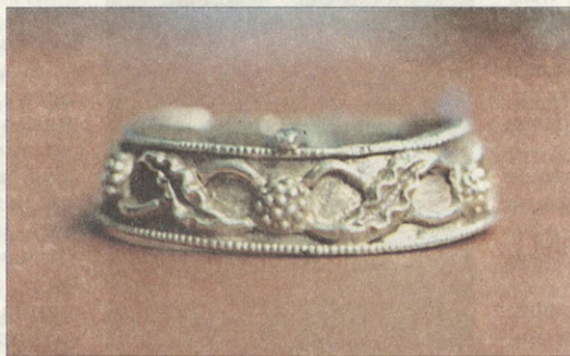
Фрагмент золотой массивной пряжки из кургана у пос. Советское Энгельского района

Появление и распространение памятников с центральноазиатскими элементами в южнорусских степях, в том числе и в Нижнем Поволжье было связано с политическими процессами VI–VII веков. Именно в это время часть территории Юго-Восточной Европы попадает под влияние Первого Тюркского каганата. Памятники этого времени в Нижнем Поволжье практически не известны, поэтому золотую пластину из поселка Советское археологи относят к настоящей сенсации.