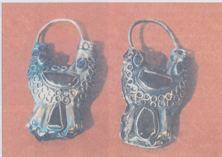
Золотые серьги-лунницы из кургана у с. Большая Дмитриевка

обкладки загнуты на обратную сторону, они имеют следы от пришивания. Эта накладка представляет собой наружную пластину-«гастангу», предназначенную для защиты ладони лучника от удара тетивой. Такое ее функциональное назначение подтверждается наличием дырочек по краю для нашивания на кожаную основу, а также тем, что она была надета на левую кисть погребенного. Техника изготовления пластины — тиснение тонкой фольги по твердой деревянной модели — говорит о том, что это изделие сделано непосредственно перед захоронением лучника и является продуктом творчества местных сарматских торевтов. Скорее всего, «гастанга» выполняла роль знака отличия, вроде погон, в сарматском военном обществе. Использование образа животного или птицы было традиционным для раннего этапа савромато-сарматской культуры. Перенос изображения животных на различные предметы, кочевники как бы наделяли вещи качествами изображенных — силой, ловкостью, быстротой, зоркостью и так далее. Не исключено, что изображения животных могли быть тотемами отдельных племен или групп кочевников, считавших их своими покровителями. Сцены терзания травоядных хищником, насторожившегося и притаившегося зверя, нередко наносились на драгоценные сосуды, обкладки мечей, нашивные бляшки.