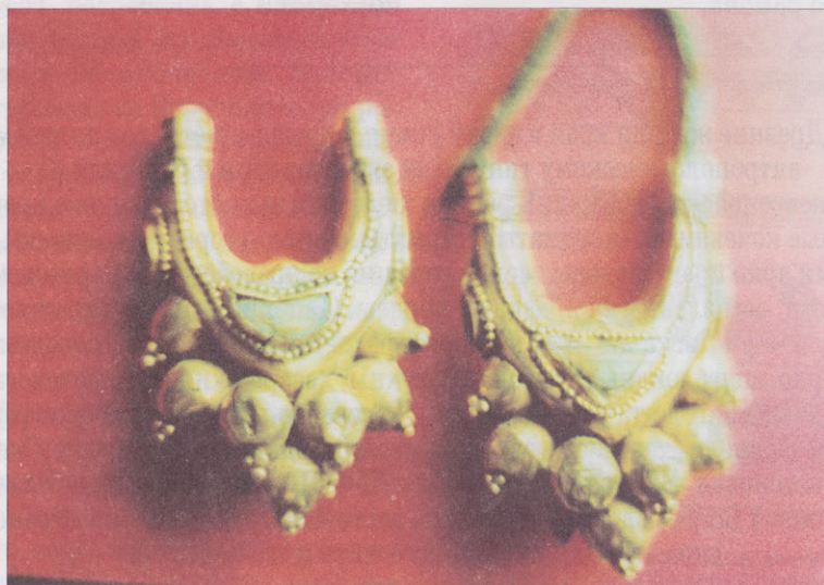
Золотые серьги-лунницы из кургана у с.Большая Дмитриевка

Но особенное внимание привлекла орнаментированная пластина, покрывавшая левую кисть умершего. Декорированная ее часть образует рамку, ограниченную вдоль коротких сторон тисненым орнаментом в виде «иоников», помещенных между двух рядов валиков. Внутри рамки находится изображение сайги, голова которой обращена назад. Складки кожи на шее, грива и хвост покрыты косыми насечками. Края