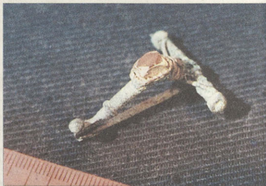
Драгоценные находки: Золотые нашивные бляшки и спираль из кургана у пос. Питерка Золотая большая бляха из кургана у пос. Советское Золотые медальоны со вставками и фибула-застежка из курганов у с. Большая Дмитриевка