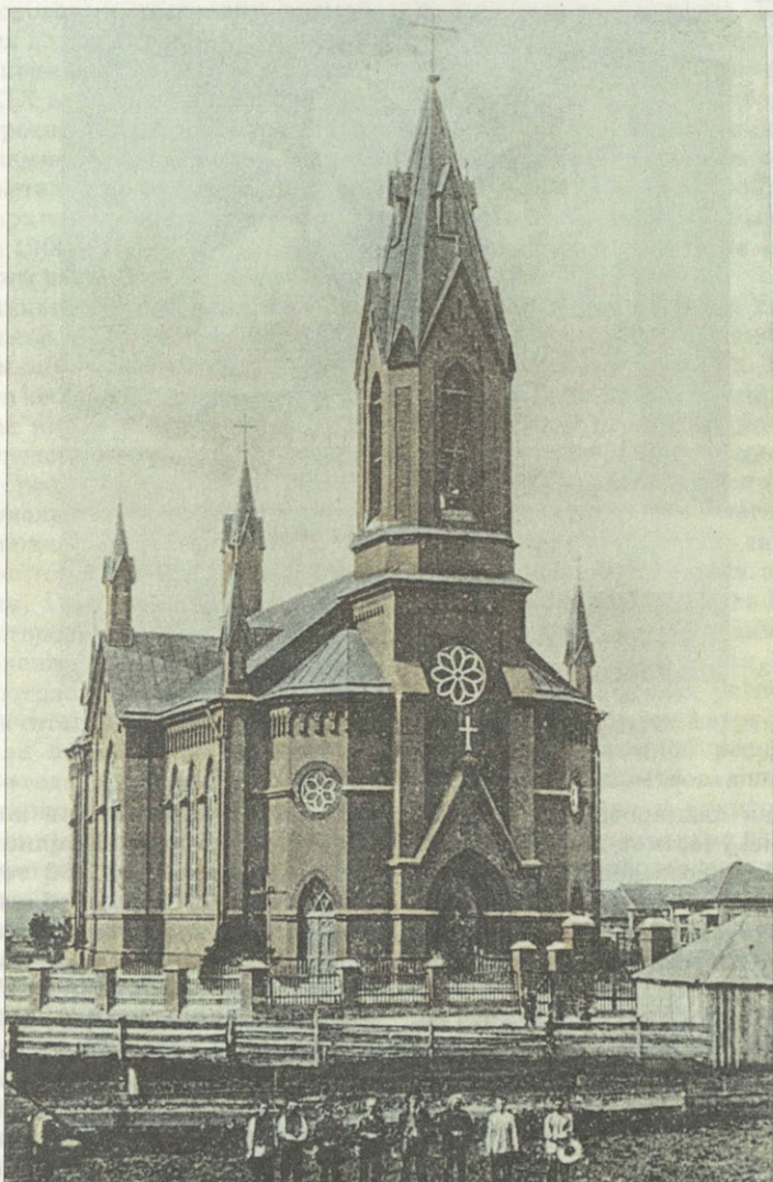
Католическая церковь в бывшей колонии Herzog на Волге. Построена в 1910 году Фотография 1910-х годов

сельского расселения. Колонии располагались на приволжской территории приблизительно от села Малыковка (ныне город Волск) до города Дмитриевска (ныне город Камышин) девятью округами — 39 непосредственно по берегам Волги; несколько правобережных (т.е. находившихся на правой, «нагорной», стороне) на Саратовско-Астраханском почтовом тракте; остальные образовали цепочки вдоль малых рек — Медведицы, Большого и Малого Караманов, Карамыша, Иловли. Типичное правобережное селение укрывалось от степных ветров и зноя в низине среди пологих возвышенностей, в перелеске. «Колония [Сосновка-Schilling] устроена в широкой и глубокой долине, орошаемой ручьем, который струится меж холмами, прежде