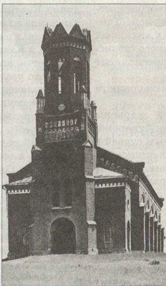
Лютеранская церковь в бывшей колонии Walter Современное состояние

Программы создания специальной группы по изучению немецкого архитектурного наследия и развитию традиционного зодчества, организации архитектурно-этнографического музея под открытым небом, проекты реставрации церквей или реконструкции заманчиво пустующих промышленных корпусов остаются пока на бумаге. И это будет до тех пор, пока все мы не осознаем, какую неповторимую ценность представляют собой безмолвные свидетели истории Поволжского края — края, где пересеклись и мирно развивались немецкая и русская, украинская и татарская культурные традиции.