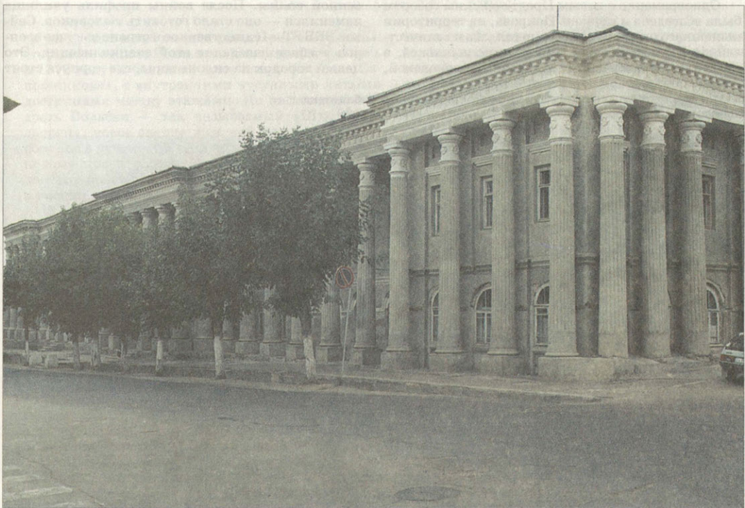
Купеческий особняк, предположительно перестроенный из старого Иоанно-Предтеченского собора после 1809 года

Гостинный двор Построен в 1810-е годы. Архитектор Н.А.Белоусов Ныне гостиница «Цемент»