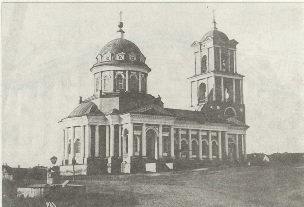
Троицкий собор («Старый собор») был главным храмом в городе с 1809 по 1844 год 1793–1809. Не сохранился. Фотография начала XX века

прежнее. Обновленное здание предназначалось для продажи городу — для размещения служб «городского магистрата». Позднее здесь помещалась «мещанская (городская) управа». Здание — ценный памятник архитектуры. Оно воплощает довольно редкий тип классической постройки с угловой ротондой и симметричными уличными фасадами.