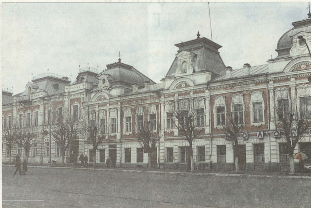
Дом купца Менькова Ныне — Вольская картинная галерея

среди прудов и небольших роц. Примечательно и старинное здание Реального училища (открылось в 1876 году) в большом доме напротив «сада Сапожникова», с внутренними чугунными литыми лестницами между этажами. Но настоящая гордость Вольска — так называемый «Школьный дворец», новое здание женской гимназии, выстроенное в начале XX века по вновь принятому типовому проекту гимназических зданий, однако достаточно дорогому и поэтому осуществленному в России всего лишь несколько раз.