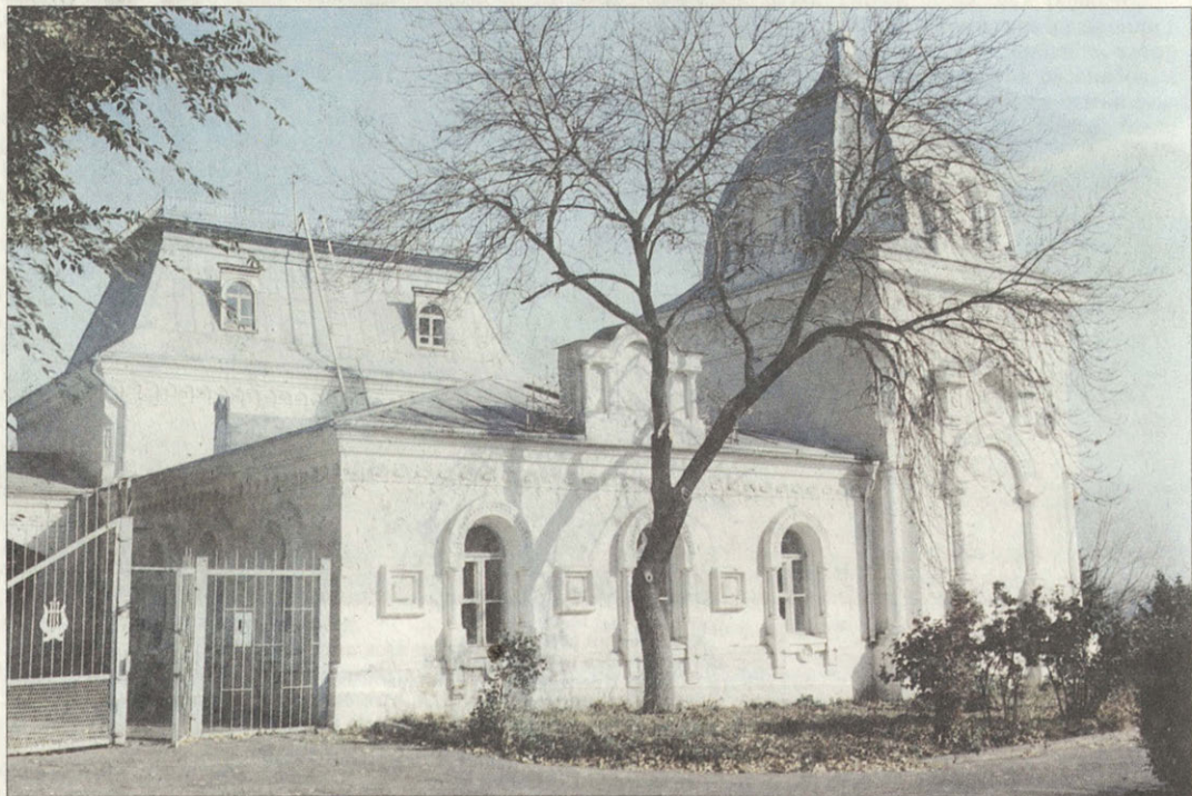
Народная библиотека 1910-е годы

С 1927 года здесь разместились Вольское училище летчиков и авиатехников, давшее стране много воздушных асов и героев Великой Отечественной войны. После войны профиль училища изменился — оно стало готовить тыловиков. Сейчас ВВВУТ — единственное в стране высшее военное учебное заведение этой специализации. Это целый городок на склоне горы, где корпуса стоят