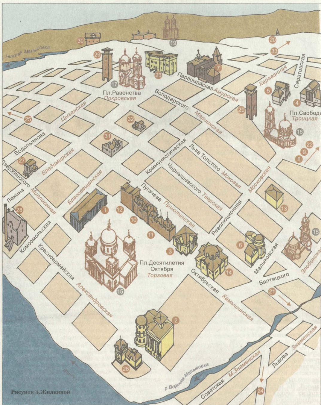
Рисунок З. Жилкиной