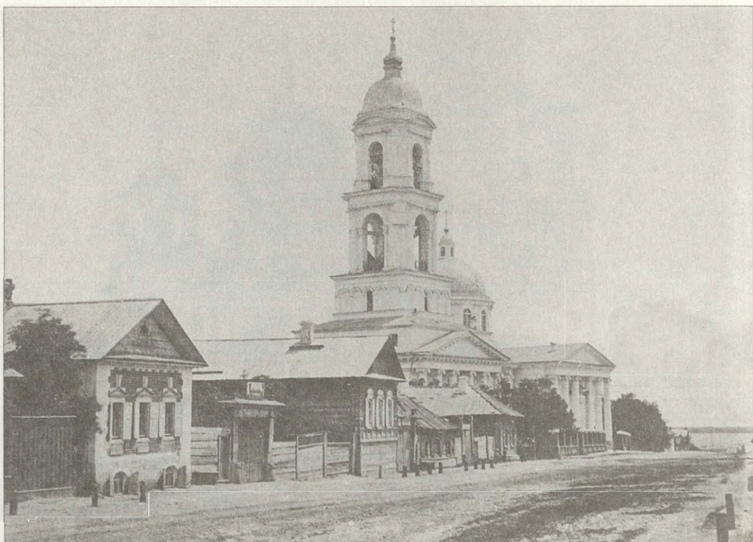
Христорождественская единоверческая церковь Построена в 1830 году. Не сохранилась