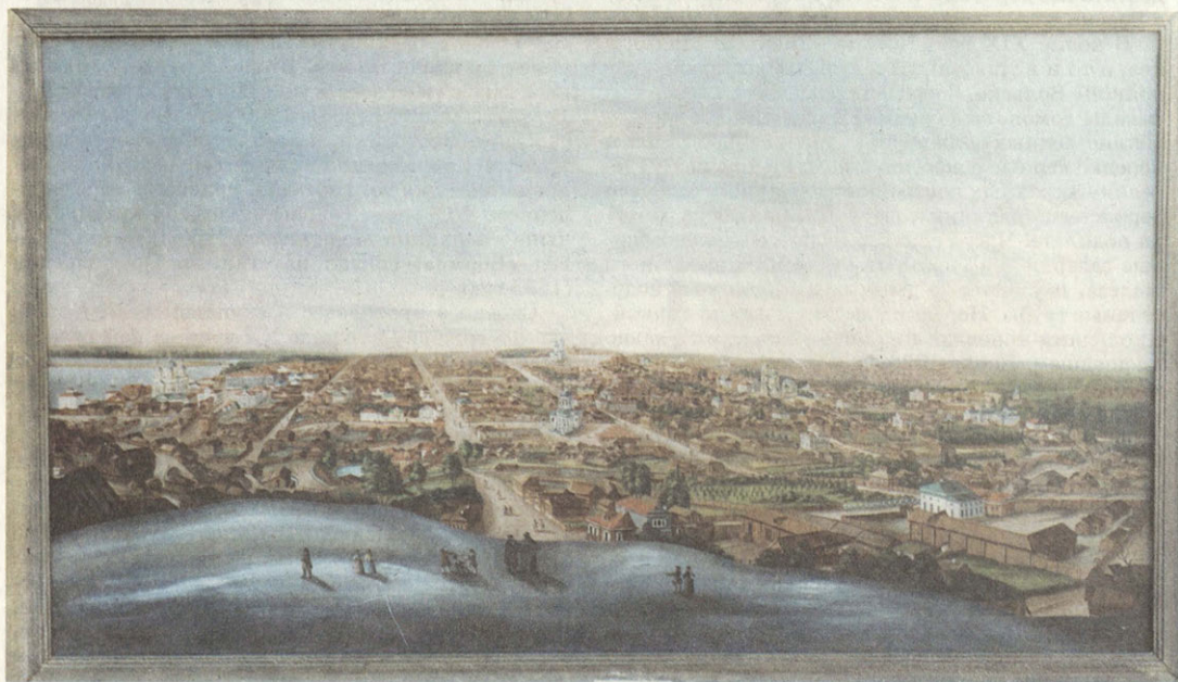
Е.Плещеев (1-я половина XIX века) Город Вольск в 40-е годы XIX века Холст, масло

Особенно значительной оказались поступления из имения графов Орловых-Денисовых: обширная семейная портретная галерея, живописные произведения европейских и русских мастеров XVIII–XIX веков,