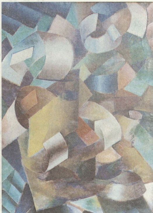
В.Д.Баранов-Россине [Даниель Россине] (1888–1942) Цветовая композиция Холст, масло

скульптуры, декоративные французские вазы, изделия русских фарфоровых фабрик, художественная мебель красного дерева. В те же годы собрана уникальная по полноте коллекция провинциального портрета конца XVIII – начала XIX столетия, представляющая в основном вольское купечество — Злобиных, Курсаковых, Сапожниковых и других.