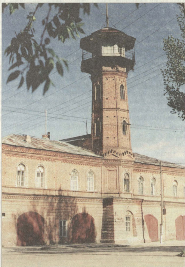
Дом купца Кашеева выстроен в «сказочном», дровнерусском стиле Конец XIX века