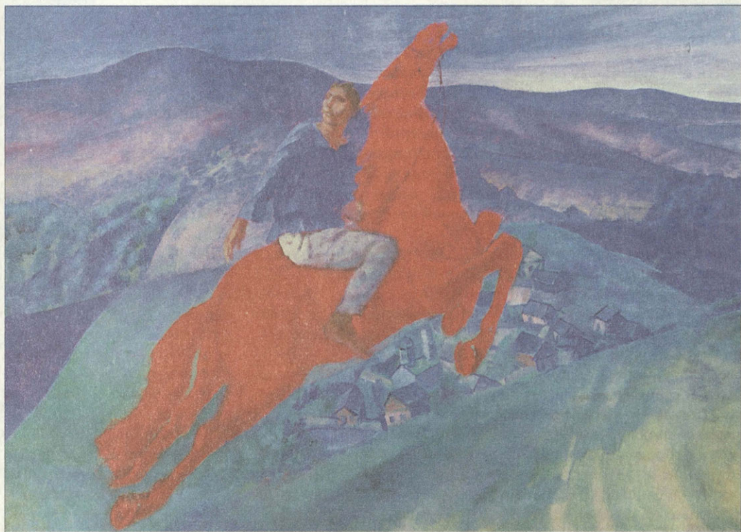
К.С.Петров-Водкин. Фантазия 1925. Холст, масло

Картина хранится в Государственном Русском музее Композиция с холмами и перелесками, с широкой рекой и рассыпавшимися по склонам деревянными домиками, рождена воспоминаниями художника о родном Хвалынске, а летящий в небе фантастический красный конь воплощает его мечту о человеческом счастье