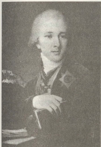
А.Ф.Лабзин Художник В.Л.Боровиковский