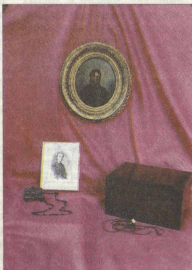
Вещи декабриста В.П.Ивашева