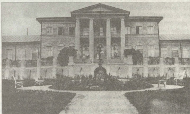
Дом фабриканта Степанова (бывший дом Языковых) в селе Языково