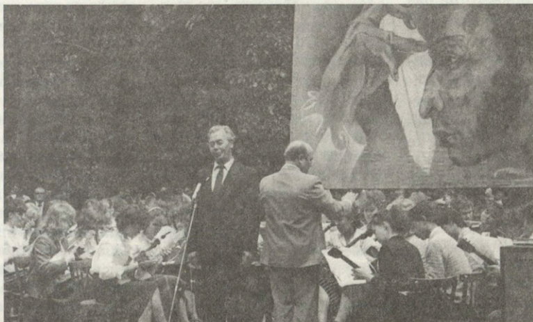
Пушкинский праздник в Языковском парке 1987