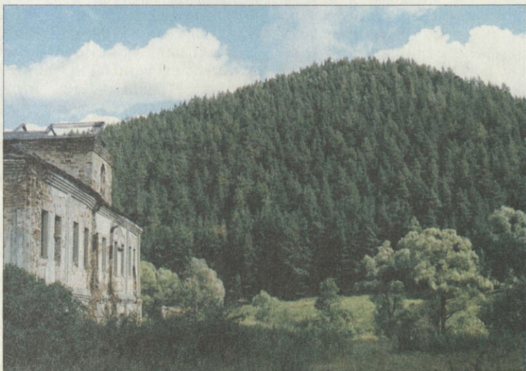
Село Проломиха. Дом Огарева Инзенский район

чтения, какое только можно себе представить. Любопытство и жажда расширить круг своих познаний... достигали поразительных размеров». Так писал П.В. Анненков, близко знавший Огарева. Далее автор воспоминаний продолжает: «...а однажды он пришел в негодование: «Я на Вас сердит; зачем не прислали книг, которых спрашивал, а именно: Курс анатомии... Я учусь систематически: энциклопедическое знание, с особенной (моей) точки зрения рассматриваемое, — вот моя цель!..»