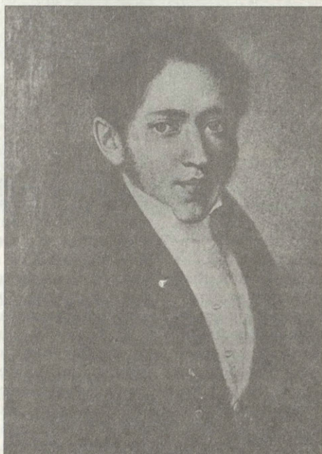
Николай Платонович Огарев 1813-1877

В тридцати шести километрах севернее железнодорожной станции Инза, близ села Проломиха, в живописной местности у излучины речки Талы стоит старый двухэтажный каменный дом. Это один из исторических памятников Поволжья.