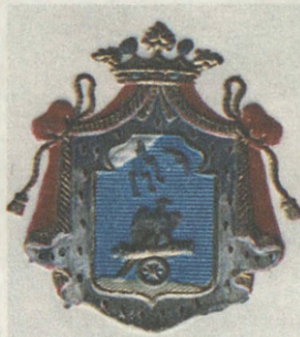
Герб Ознобишиных Наклейка на книгах библиотеки Д.И.Ознобишина

Но был в истории усадебных библиотек этого периода один очень положительный момент. К 1925 году, к моменту открытия Дворца книги имени Ленина в Симбирске-Ульяновске (ныне Ульяновская государственная областная научная библиотека), большая часть многотысячного книжного имущества губернии, около 300 тысяч томов, была сосредоточена именно в этом новом учреждении. Все годы, предшествующие открытию библиотеки, делалось немало