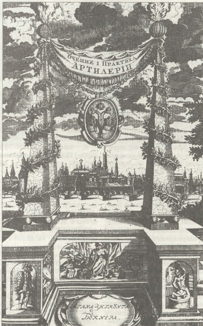
Гравюра из книги «Учение и практика артиллерии Бухнера» Москва, 1711

дворянства. Книги «Наставник земледельческий...» Томаса Боудена (М., 1780), «Генеральное учреждение. О сборе в государстве рекрут...» (СПб., 1766), «Генеральные правила, данные межевой комиссии для сочинения по оным межевой инструкции» (СПб., 1765) и т.п. были чрезвычайно необходимы в хозяйстве помещика.