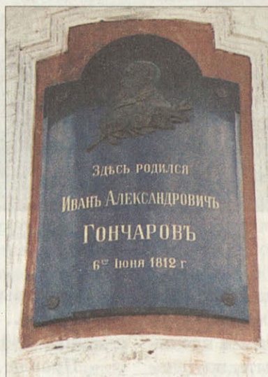
Мемориальная доска на доме Гончарова