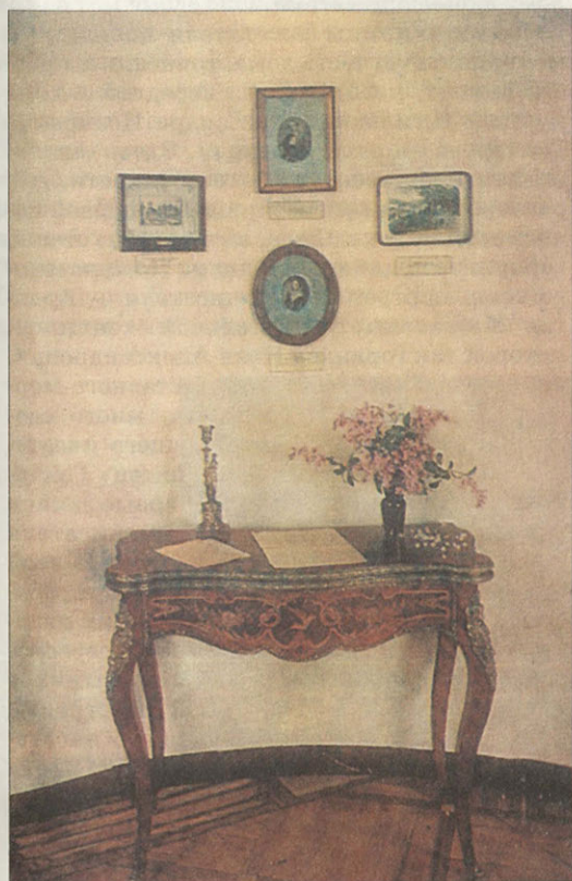
Фрагмент экспозиции «Работа над романом «Обломов» в Мариенбаде» 1857 год