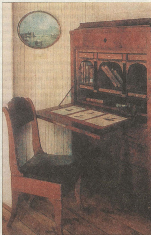
Фрагмент экспозиции «Каюта на фрегате «Паллада» Середина XIX века