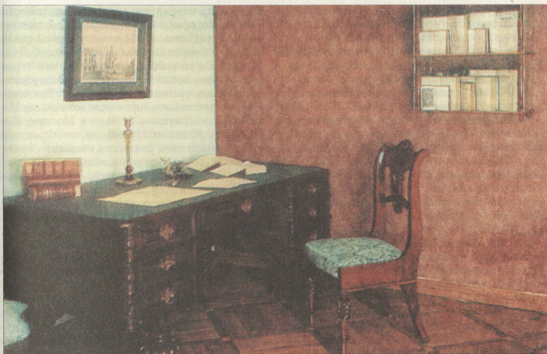
Экспозиция музея «Служба И.А.Гончарова в департаменте внешней торговли Министерства финансов» 1835–1852 годы