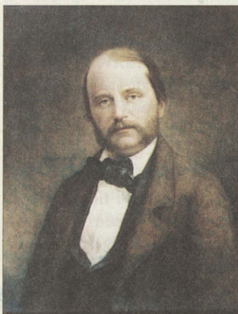
Н.А.Майков Иван Александрович Гончаров